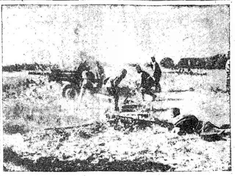
Sovietų lauko kanuolė šauda su smarkumu, kad tik dau- pažintų, kanuolė pridengta priešą. Kaip matote, tai giau sovinių iššovus į prie- šakomis. Gabus užsimaskavi- darbas prie kanuolės eina vi- šio pozicijas. Kad priešas ne- mas dažnai priešą apgauta.