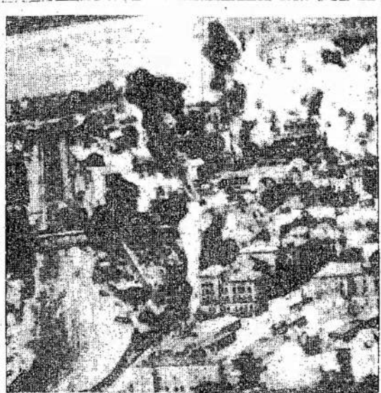
Britų orlaivių uždegti ir sugriauti vokiečių fabriai šiandien yra kasdieniniai reišiniai Vokietijoje. Čia matote išbombarduotą gelžkelių imo-

Hitlerio ir Musolinio armijos Tunisijsioje visai sutrius- kintos. Britų, amerikiečių ir francūzų jėgos pribalgė jas daug greičiau, negu kad buvo laukiama. Amerikiečių, britų ir francūzų blitzkriegas Tunisijsioje buvo smarkesnis, negu kad pačių vokiečių kurama nors fronte Europoje. Vokiečių ir italų jėgos, kaip pasirodė, buvo pusėtinai didelės. Patiektais daviniais remiantis, jų buvo virš pusantro šimto tūkstančių vyrų. Bet kaip tik amerikiečiai, britai ir francūzai progamtines tvirtumas prasiveržė, tai poros dienų užtekė pakrikdyti vokiečius ir italus. Hitlerio ir Musolinio armijos buvo sukaptos į dalis ir sumtos, su ginklais ir generolais.