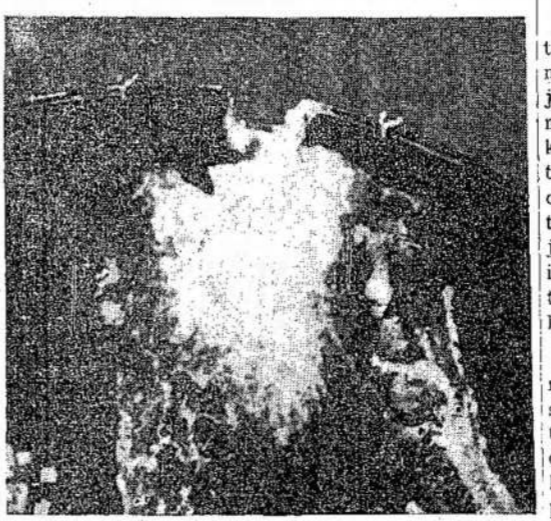
Ši iš orlaivio nutraukta nuotrauka parodo Mohne užtvanką su plyšiu, kurį padarė britų bombardierių torpėdos. Vanduo pleška iš tvenkinio visu smarkumu.