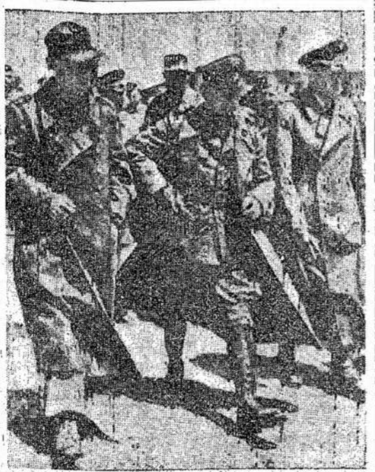
Vokiečių generolai sumiņę. Su jais buvo paimta Tunisijoj. Jų "bitvokrięų" virš 200,000 vokiečių ir ita dienos jau baigtos. Tunisijoj, o taipgi daugybė buvo sumita virš 20 generolų kitokio grobio.