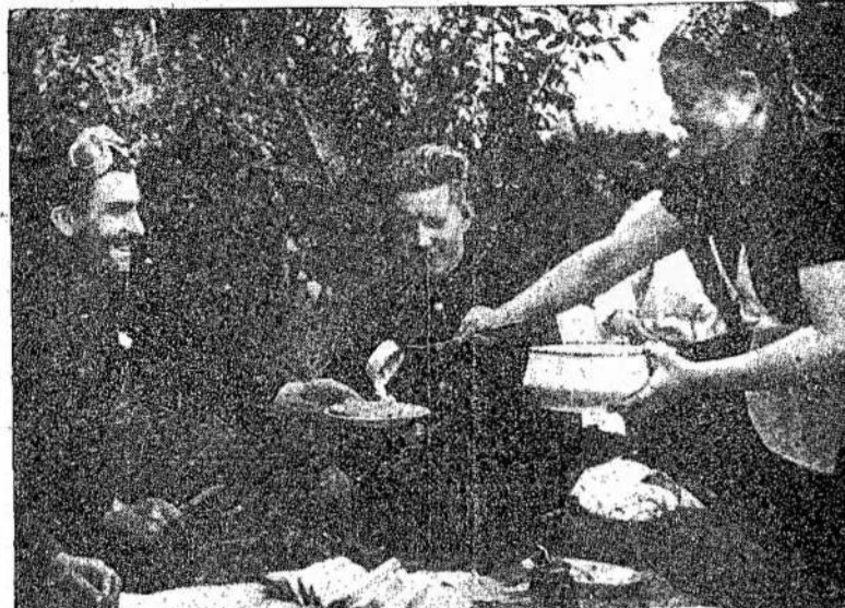
Sovietų Sąjungos kolektyvie-ti su dideliu malonumu patarnauja narsiems Raudono-jo Orlaivyno lakūnams, kurie vienos dienos metu su-