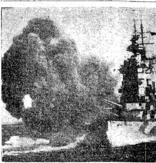
Pirmą iškėlimo kariuomenės Italijoje, britų didieji karo laivai pleškino italų pozicijas iš savo didžiųjų kanalių. Čia matote H. M. S. Nelsoną šaudantį Italiją iš savo 16 colių kanonių. Italai negalėjo atremti atakas.

LONDON. — Visas pasaulis tikėjosi, kad vokiečiai šią vasarą bandys išnaujo pulti Raudonąją Armiją. Daugelis tikėjosi, kad vokiečiams šiemet bus daug sunkiau, negu praėjusią vasarą. Bet labai mažai manė apie tai, kad Raudonoji Armija galės taip pasirodyti, kaip ji dabar pasirodo. Atmušus vokiečių pragariską visų jėgų ataką, ji pradėjo savo ofensyvą, kuri tęsiasi ir dabar. Ne tik tęsiasi, bet kartais virsta šturmu. Pereitą savaitę per kelias dienas buvo išlaisvinta iš vokiečių nagų po kelis šimtus kaimų ir miestelių. Dabar prieš Raudonosios Armijos akis stovi Stalino, Poltava, Brianskas, Smolenskas ir kiti Sovietų miestai, kurie vokiečių rankose nuo pat pradžios Vokiečių-Sovietų karo ir kurių užėmimas atitiktų iš priešų svarbius pasipriešinimo punktus ir priverstų juos trauktis už Dniepro upės. Bet atrodo, kad ir minėti punktai bus greitai įaimti, nes pranešimai iš fronto rodo, kad nacių jėgos Doneco baseino fronte pradeda kriti ir trauktis atgal galvotrūkiomis. Užėmimas Kanotopo miesto, kuris randasi ant gelkelio tarp Kievo ir Briansko, skaitomas pavojumi pačiai Kieviui. Stalino, Doneco baseine, skaitomas svarbiausių nacių punktu pietiniame gale, bet jis jau kaip ir apspustas.