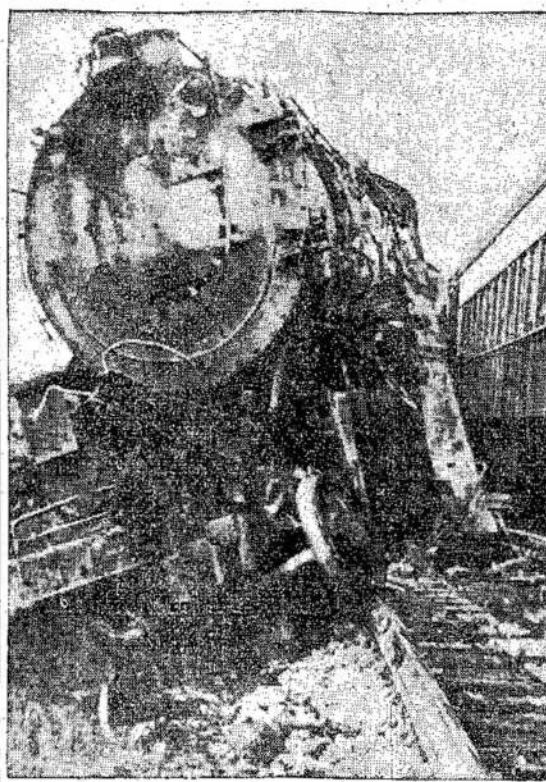
Net dvidešimt septyni asmenys buvo užmušti ir daug sužeista, kuomet garvežys susikūlė su pasažieriu traukiniu Waylande, N. Y. Karštas geras iš garvežio daugelį apdegino, kuomet garvežio kubilas pratrūko.

Daro operacijas ir gydo įvairias ligas, įskaitant odos ligas, olcerį, vėnas ir astmą. Turi modernias Electro-Therapy mašinas. 597 COLLEGE ST. — TORONTO Tel. ME. 5090