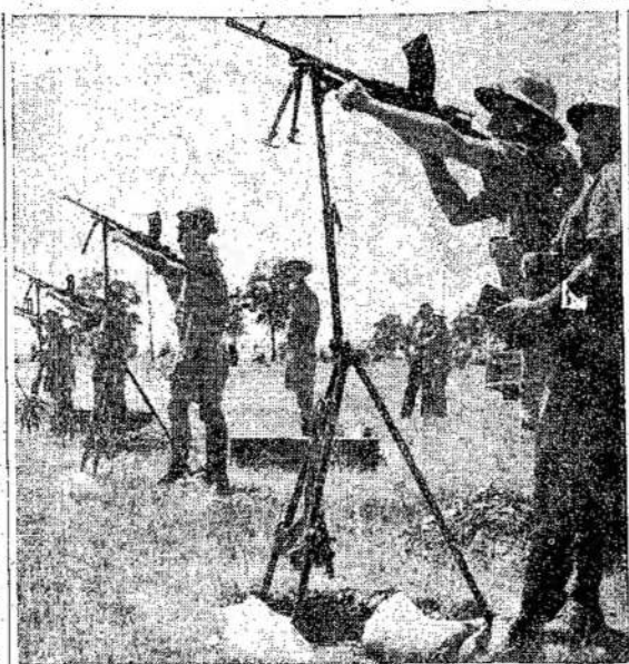
Kanada pagamina po 13,000 įvairių šaudyklų kas savaitę, įskaitant Bren, Sten ir kitus automatinius šautuvus. Nuo pat karo pradžios pagamino jau 750,000. Čis matote demonstruojant keltą lengvų automatių ginklų, kurie plačiai naudojami visuos frontuos.