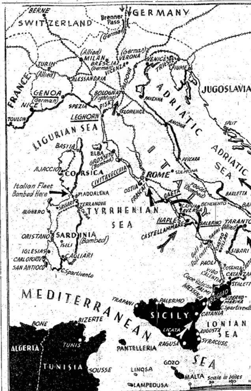
Vokiečiai parodė netikėtus kėčius, kurie išsikėlė apie jėgas Salerno sektoriuje. Jie pirmyn ir jau nuėjo už Bari rytuose ir Cosenza centre. Vokiečiai giriiasi ties Salerno apsupti kanadiečius.

LIAUDIES BALSAS Yra Visų Lietuvių Draugas