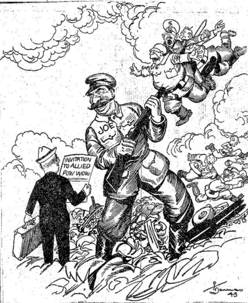
"PASAKYK JIEMS SUSITIKTI SU MANIM BERLYNE"

Būtų labai gerai, kad visų sumą galėtų paskolinti darbo žmonės. Žinoma, visą sumą bus sunku, bet reikia stengtis skolinti kaip galima daugiau. Kuo daugiau dar-