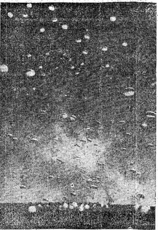
Kanadiečiai parašutininkai Chilo kempėj. Manitoj, laike pratimų. Šitie vyrai savo lavinimasi užbaigė ir ga-

Kanados Lietuvių Nacionalis Komitetas savo posėdyje priimdamas Pirkimo-Siuntimo Komisijos raportą, priėmęs jį, tarėsi ir svarstė apie pasiuntimą antro dovanų siuntinio mūsų broliams ir seserims kovojuojantiems už Lietuvos išvadavimą ir taigpi lietuvių vaikūčiams. Komitetas matydamas, kad tokių dovanų pasiuntimui kelias yra lengvas, užtikrintas ir atviras ir suprasedamas, kad dauguma Kanados lietuvių trokšta, jog dovanų siuntimas nesustotų, nutarė pradėti vėsti vaju, kad sukėlus pakankamą fondą pasiuntimui dar didesnio dovanų siuntinio. Vaju nutarta pradėti tuojau. Bus padarytos aukoms rinkti blankos ir išsiuntinėtos į draugijų kuopas. Taipgi bus kreipiamasi į visus veiklius draugus pasidarbuoti. Tiesa, daugelis mūsų kolonijų labai gražiai pasidarbavo del šio pirmo siuntinio. Daugelis draugų bei draugių prisuntė savo duosias aukas, nors oficialaus vajuas tam tikšui nebuvo vėsta. Bet nekuriuos kolonijos mažai teprisidėjo, arba visai neprisidėjo. Reikia joms duoti progos. Be to, ir iš jau pasidarbavusių kolonijų, atsiras draugų, kurie norės savo auka prisidėti ir prie antro siuntinio. Kiekvienas doras Lietuvos patriotas supranta kokią šventą kovą veda mūsų broliai kovodami prieš vokiečius okupantus, supranta kovotojų reikalus ir esančius trūkumus. Kiekvienas do-