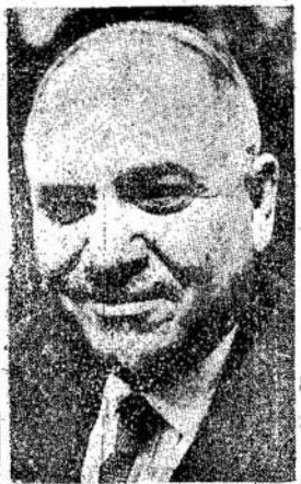
Ivan Maški SSRS užsienio reikalų vicekomisaras. Jis dabar Londone. Sakoma, kad Londone yra rengiami Amerikos, Britanijos ir SSRS atstovų konferencijos planai.

— Jūs, lietuviai, rasiniu požiūriu esate žemesni. Bet jūs darbštūs, ir mokate nebiogai žemę dirbti. Bet jūs gyvenate ne toje vietoje, kuri jums tinka. . . Artėja laikas, kai mes, didieji, pradėsime suvedinėti savo sąskaitas. Artėja didelių įvykių metas. Mes, vokiečiai, lietuviams draugiškai ir nuširdžiai linkime: kai mes, didieji, susikibsimė, — jūs nespainiokite mums po kojomis. Jei laikystės išmintingai, po karo mes jus — visą tautą — nukelsime į puikias, derlingas žemes, ten kur nors apie Tulą. Jūs ten puikiai galėsite įsikurti ir ugdyti savo puikią ple-