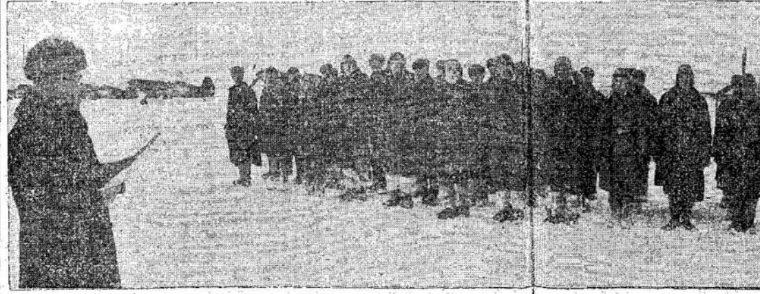
Lietuvos Tarybų Socialistinės Respublikos Liaudies Komisarų Tarybos pirminin-