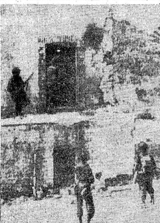
Jungtinių Valstijų Penktoji armijos pėstininkai medžioja vokiečius viename miestelyje netoli nuo Salerno, kuris pirmas buvo užimtas amerikiečių jėgų.

Kova del Neapolio parodys, ant kiek stiprūs vokiečiai Italijoje.