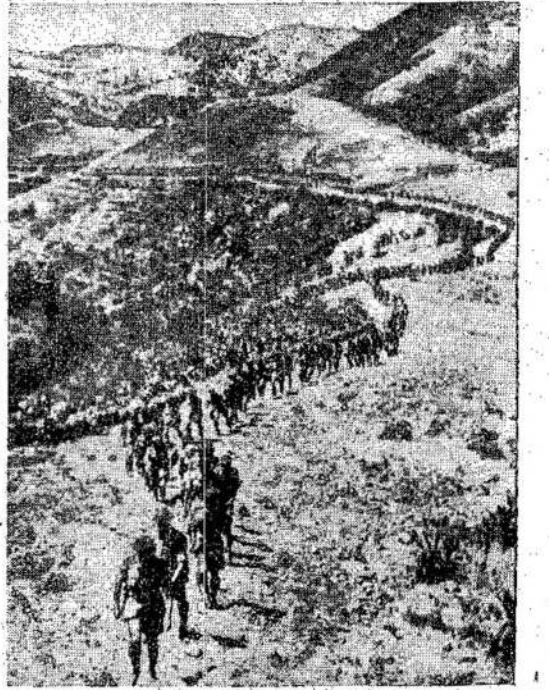
Kanadiečiai traukia Cicilijos tarpukalmėmis. Šis jų žygis įvyko užbaigus kampaniją. Jie čia matomi maršuojant išklauyti generolo Montgomerio kalbos apie kovas Cicilijoje. Jie dabar kovoja Italijoje kartu su Astunta britų armija ir amerikiečių Penk-

OMAHA. — Generolas Marshall sako, kad didelė ofensyva visai arti.