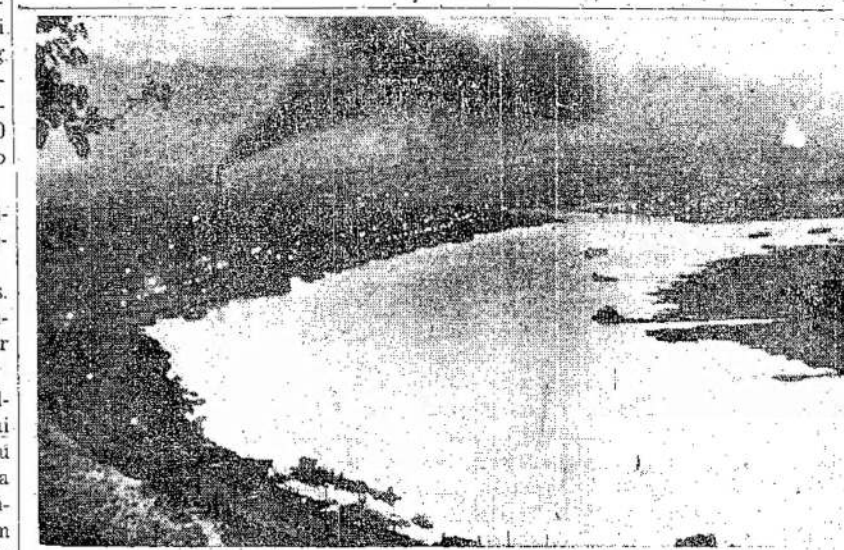
Garsioji Dniepro upė, kuri dabar karo ugnyje. Vokie- čiai tikisi, kad Dniepras pa- paveikslas nutrauktas taikos

ALGIERS. — Francūzai jau nugalėjo vokiečių jėgas Korsikos saloje. Vokiečiams nebėra vilties atsilaukyti, nes iš jų atimta visi svarbieji miestai ir prieplaukos.