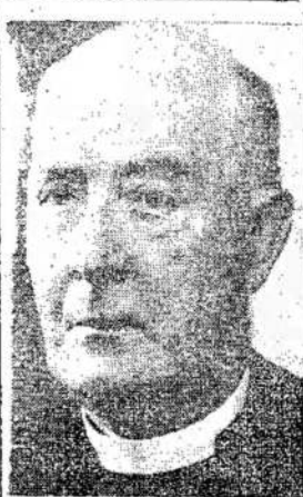
Yorko arcivyskupas, kuris buvo nuvykęs i Maskvą ir matėsi su rusų stačiatikių bažnyčios viršininkais. Jis sako, kad Sovietų Sąjungoje pilniausia religijos laisvė.