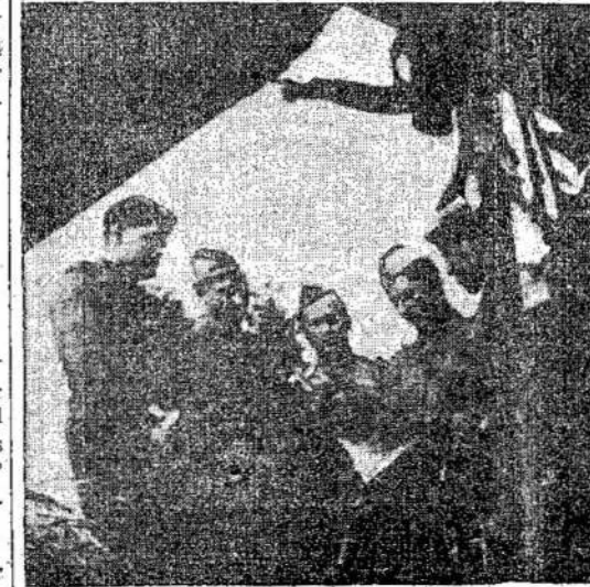
Lietuviai kariai Briansko Babrausko kuopos kariai Raudonosios Arimijos laimėjimus, kurie yra kartu ir jų laimėjimai.

Tokiu intensyviu mūsų, kokie eina Sovietų Sąjungoje, dar nėra buvę visoj karų istorijoj. Tik įsivaizdinkime. Nacių kariuomenė pirmą kartą užimdama naikino viską nepaliaujamu bombardavimu. Taipgi Raudonoji Armija atsitraukdama naikino viską tą, kuo galėtų priešas pasinaudoti. Dabar vokiečiai atsitraukdami vėl antru kartu viską naikina ir griaua. Gi istijos sritys, rankas mairė bent po keletą kartų, kaip pavyzdžiui, Charkovo sritis. Per kelius sykius ji buvo vokiečių užimta ir taipgi per kelius sykius vėl išvadota. Mes galime įsivaizdinti į ką paversti derlingieji laukai,