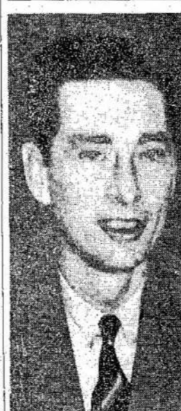
Grafas Alfred de Marigny, kuris dabar teišiamas Bahamoj. Jis kaltinamas nužudymė kanadiėcio multimilijonieriaus Sir Harry Oakes, kuris buvo rastas užmuštas ir apdegintas. Grafas de Marigny yra vedęs su Oakeso dukteria. Sir Harry Oakes kiek metų atgal pabėgo iš Kanados, kad nereiktų mokėti taksus.