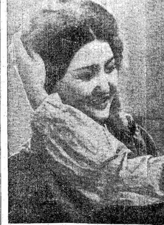
Pildydamas Sovietų vyriausybės tautinės politikos principus, Valstybinis Teatrinis

— Nenusiminkite, broliai! Didžioji Sovietų Sąjunga neapleis jūsų nelaimėje. Mes ateiame jūsų išgelbėjimui ir jau ne už kalną ta valanda, kada mes būsim laimėtojai! Kovokite, muškite priešą, kaip ištikimi Sovietų gimtinės sūnus. Mūsų vieningumas neįveikiamas, mūsų broliškumas sutvirtina s krauju bendrojo kovoj, mūsų ateitis iškovojo bendromis pastangomis. Tegul Gyvuoja Tarybinė Lietuva! Tegul Gyvuoja Tarybinė Latvija! Tegul Gyvuoja Tarybinė Estija!