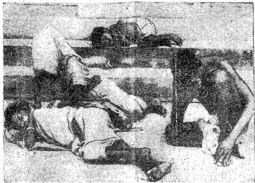
Si Kalkutos (Indijos) šeimyna pamazū miršta iš bado. Jau tūkstantai išmirė Sakoma, kad po 200 žmonių dieną miršta vien Kalkutoj. Jau tūkstantai išmirė iš bado ir dar daugiau gali mirti, nes badas spaudžia didį skaitų žmonių. Badą išaukė maisto spekuliatoriai.