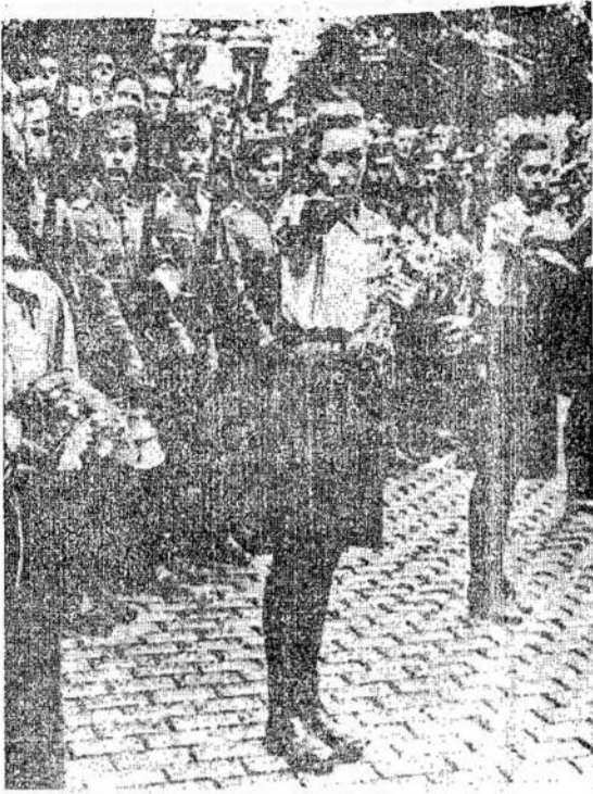
Buvusio Bulgarijos karaliaus Boriso šalininkai karalium, kuris buvo kažkieno nudėtas po pasinaty-mo su Hitlerju.

Mes atžymime tą istorinę dieną, kada trys metai atgal dirbantieji Lietuvos, Latvijos ir Estijos piliečiai iškėlė virš savo šalių garbingai