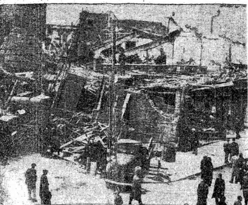
Štai kaip atrodo šokių salė, 6. salėje esanti daugeliui šokėjų, jį tarpe ir kanadiečių. Daug buvo užmušta ir sužeista. Bet už tai vokiečiams yra užmokama šimteriopai.

Pagarba Molotovui, Edenui, Staliniui "Šia proga man labai smagu pareiškinti asmeniškai pagarbą tiems žmonėms, su kuriais turėjau laimės tartis Maskvoje. Mr. Molotovas buvo sekmiausias padarė pa-