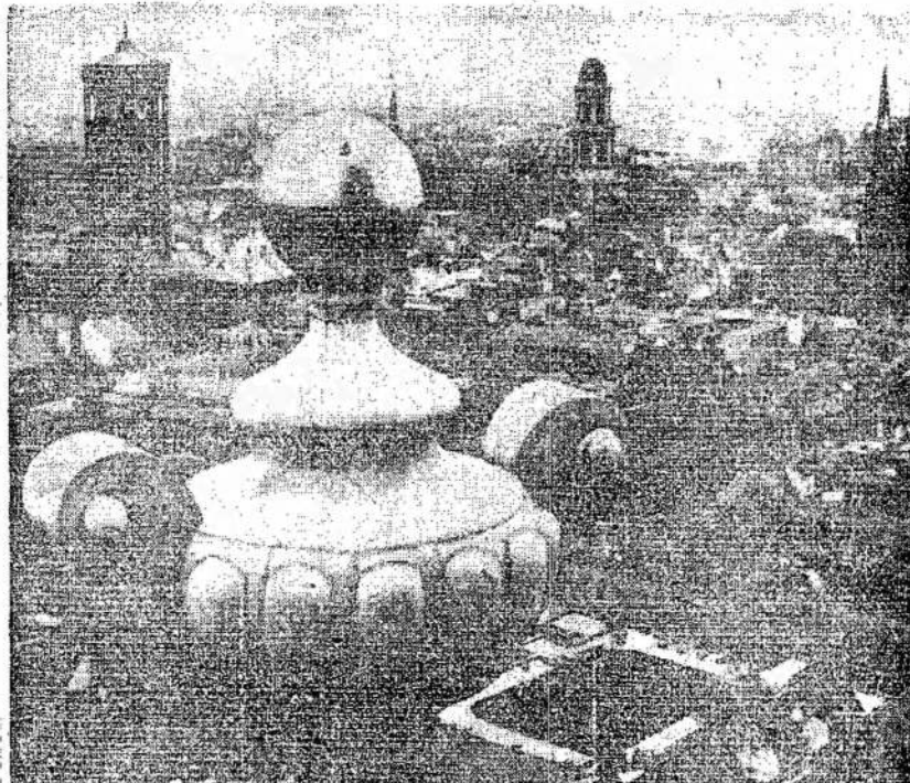
Berlynas, nacių žūties židinys. Po britų ir kanadiečių atakų iš oro jo veidas visai pasikeitė. Vietomis išsibėkai paversti griūvelės. Viso jau 5,000 tonų bombų buvo numesta ant Berlyno. Bet tai tik pradžia.

Komiteiui į talką ateina gelžkelių kompanijos, kurios sutinka vežti pristatyti drabužius į Torontą iš bile kurio vietos rytinėje Kanadoje. Drabužiai turi būti siunčiami Ontario Clothing Division of the Canadian Aid to Russia Fund, 918 St. Clair Ave. W., Toronto, Ontario.