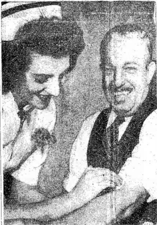
Naujas kraujo aukavimo kraujo del-Raudonojo Kryžiaus. Jis čia matomas po 110-to aukavimo, kartu su karta paaukavo 154 pintes

Kaž kur mūsų krašto valdžia yra, kad tyli ir nieko nedaro tokiems nacizmo skleidėjams.