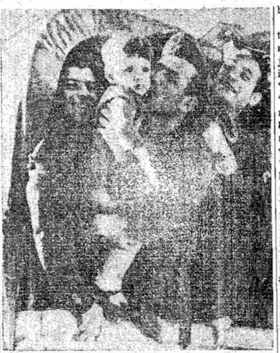
Italai šiame kare kovojo vokiečių pusėj, bet nuo to laiko, kada Italija suklypo, jie pasidalino pusiau: fašistai kovoja vokiečių pusėj, o antifasistai — sąjungininkai. Čia matote būrį italų išvažuojantį į frontą sąjungininkams padėti. Tėvas atsisveikina su savo sūnelu.

Dar kartą prašome, kas turite kareivių adresus, malonėkite prisiusiti Liaudies