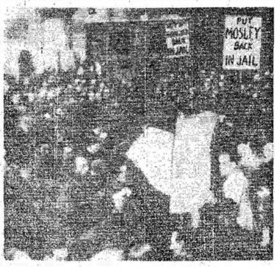
Londono darbininkų demonstracija prieš paliuosavimą Britanijos fašistų vado Sir Oswald Mosley. Britanijos darbininkai vienu balsu šaukia: "Padėt Mosley atgal į kalėjimą."

KIJEVAS. — Vokiečiai, atrodo, pradeda bijoti, kad gali tapti užmojęti už tas žmogžudystes, kurias jie padarė Sovietų Sąjungoje. Jie stengiasi ištrinti žymes nors patį didžiųjų žmonių skerdynių.