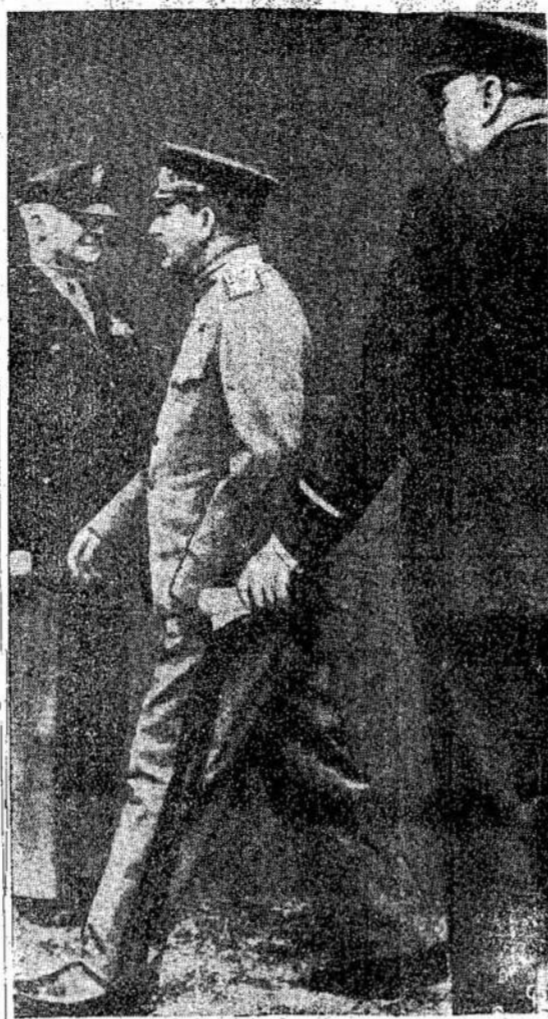
Per pertraukas, Teherano konferencijos dalyviai laiką leidė sodnė prie Sovietų ambasados rūmų. Siame atvaizde matote Staliną besįvaikštant sodnė Kairėj matomas generolas H. H. Arnold, USAAF komandierius, o dešinėj — premjeras Čiorčilis, pasivaikščiojimo metu.