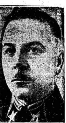
Maršalas Vorosiļovas, kuris dalyvavo Teherano konferencijoj kartu su Stalium.