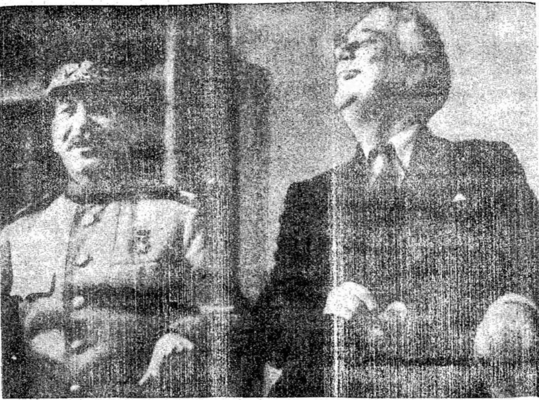
Maršalas Stalinas, Sovietų Sąjungos premjeras, ir prezidentas Ruzveltas, vyriausios Jungtinių Valstijų komisijos mandierius, sėdėdami vienas prie kito. Jie susitiko Teherane, Persijos sostinėje, kur jie abu ir Giorčilis, dalyvaudant visų trijų šalių diplomatiniams ir militarinėms vadams, apkalbėjo karo ir taikos klausimus.

WASHINGTON. — Russian War Relief organizacija pasiuntė Sovietų Sąjungai medikalių ir kitokių reikmenų jau už $22,000,000.