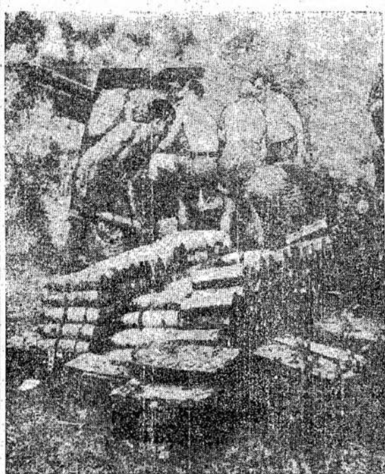
Cia matote kanadiečių prieš savo klanuolės ir krūvos šovinių. Jie ne viena tokią krūvą sovinių paleido priešopu.

Bombierių komanda pasveikino Berlyną su 1944 metais dviem dideliais bombardavimais, per kuriuos buvo numesta arti 2,000 tonų bombų.