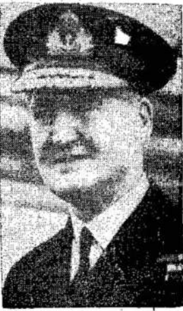
Admirolas Sir Bruce Fraser, britų jėgų laivyno komandierius. Jo laivynas neseniai paskandino nacių karoljauž Scharnhorst.