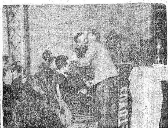
Vaidas iš paminėjimo lietuvių poeto Ludo Gira 40 metų literatūrinio darbo sukakties, 1943 m., birželio 25 diena, Maskvoje. Sovietinių Rasytojų Sąjungos prezidento narys sveikina jubiliejaus linkėdamas gero pasisekimo.