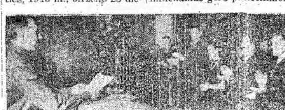
Poetas Liugas Gira kalba susirinkime, suruoštame paminėti jojo 40 metų literatūrinio darbo sukaktį Maskvoje, birželio 25, 1943 metais.