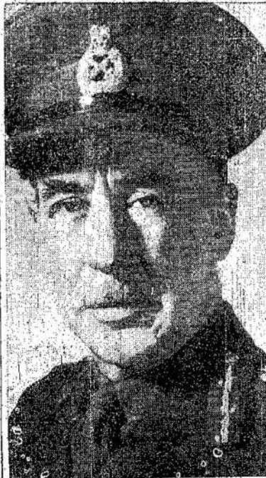
Kanados armijos užjūryje komandieriai. Iš kairės į de- šinę: leit. generolas K. Stu-