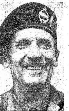
Generolas Sir Bernard Mont- gomery, buvęs britų Aštun- tosios armijos komandierius. Dabar jam pavesta vadovau- ti britų jėgoms, kurioms ya- ra skirta smogti vokiečiams iš vakarų.