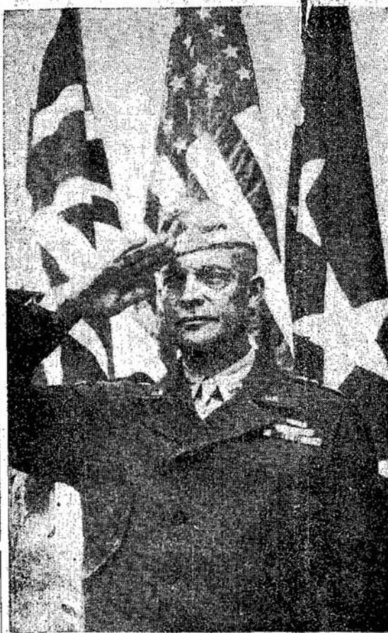
Generolas Dwight D. Eisenhower, neseniai paskirtas vyriausiuoju Jungtinių Tautų jėgų komandierium vadovauti antram frontui, kada jis bus atidarytas.

Kartu atsistos prieš mus ir Lietuvos žmonių rėmimo klausimas. Lietuvos žmonės bus labai išvargę ir apiplėšti. Jie šauksis prie Amerikos lietuvių. Jau laikas mums pasirengti stoti jiems į pagalbą.