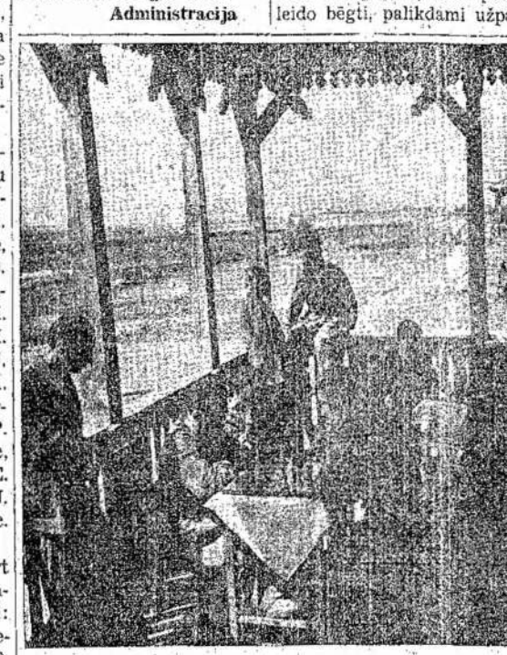
Lietuviai kovūnai, nariai šio name. Kada jie pataisys frontą kovai už išlaisvinimą Lietuvos, tai grįš atgal į Lietuvos.

me, mūsų buvo tik 60. Mes, tačiau, nutarėm stoti kovon su vokiečių policija. Apsupę kaimą, davus ženklą, mes puolėm į gatvę. Vokiečiai matomai neatspėjo, kiek mūsų buvo, todėl pasileido bėgti, palikdami užpa-