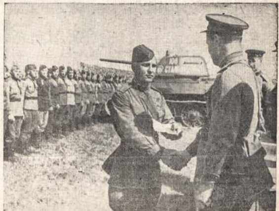
Leningrado fronto tankistai apdovanojami medaliais už narsumą veičiant vokiečius nuo Leningrado. Užpakalyje matomas tankas sunaikino vokiečių pancerius, Dabar vokiečiai jau nuvyti toli nuo Leningrado — Lenino miestą.