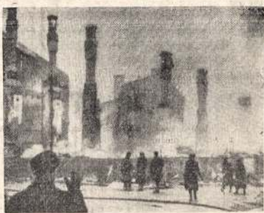
Industriinis Helsinkio distrikas po Sovietų ataką iš oro. Juo ilgiau suomiai išsilaikė, tuo daugiau jų industrialai nukentės. Suomiai labai greitai šokė į talką vokiečiams, bet dabar nori tokios talkos, kad ir vokiečiams neušaidyti ir su Sovietais susigerinti. Vargiai tas pavyks.

Buvo prižiūrėta duoti po pakelį amerikoniškų cigarečių visiems, kurie patysįgi taikiškai visus tris šovinius. Stengėmės ir mudu su Alks-