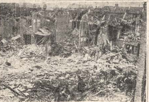
Naciiai pastaruoju laiku priūnė kelias naujas bombardavo Londoną, kad kariai būtų daug mažesni, ne-

DEPARTMENT OF LABOUR HUMPHREY MITCHELL, A. MacNAMARA, Minister of Labour, Director, National Selective Service, B-6-44-W