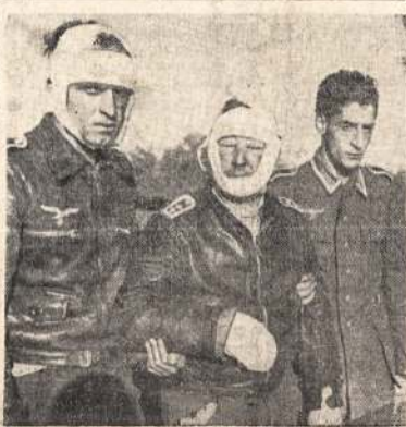
Trys vokiečių Stalco orinivinklai su nusiminusiais veidais ir aprištomis galvomis.

NEW YORK. — Majoras La Guardia kalbėdamas per radio pareiškė, kad Amerika turi sekti Britaniją ir remti maršalą Tito. „Aš noriu, kad mūsų valdžia pasakytų: „Tito, jis atliko gerą darbą, todėl, Tito, mes esame su jumis“,“ pareiškė La Guardia.