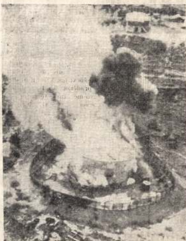
Sis iš orlaivio nuimtas vaizdas parodo degant pusę milijono galionų japonų gazolinu Burmoje. Jis buvo uždeg-