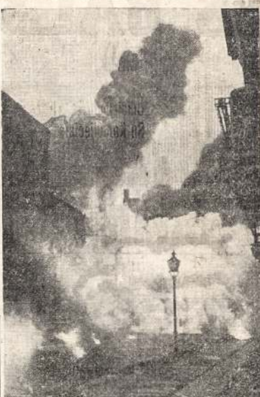
Viena Berlyno gatvė laike bombardavimo iš oro. Pavieklas nutrauktas pačiu vokiečių. Tokių gaisrų būna tūkstantai po didelių bombardavimų.

Kodėl gi priešintis tam bilium? Matomai ta spauda gina laisvę tų, kurie ardo Kanados žmonių santykius, kurstydami vieną rasę prieš kitą. Jiems, matomai, nepatinka, kad bus uždrausta kelti nesantaiką, nespaikant, Bet taip elgiamiesi jie šieina prieš krikščionybę, prieš Kanados interesus. Kas kursto kanadiečius, ardo vienybę, pasinaudamas rasiniais skirtumais, tas yra prastas kanadietis.