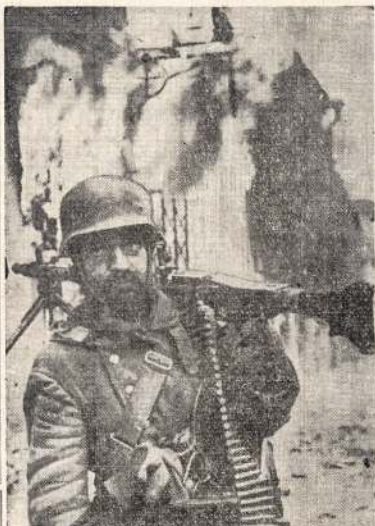
Štai jums priešas. Šis naciš su savo kulkošvais ant pe- ties buvo nutrauktas aplėdi- džiant Žitomirą, paskandin- tą liepsnos. Jam, tačiau, ne- pavvyko toli nubėgti. Už sa- vo darbus jis užmokojo gy- vybę.

OTTAWA. — Kanada pasi- untė Graikijos žmonėms 260,000 tonų kviečių, kaip pranešė ministras pirmin- kas King parlamento na- riams. Šita pagalba Graikijos žmonėms suorganizavo Šve- dijos vyriausybė, vadovu- janti miestytau Tarptautinio Raudonojo Kryžiaus komite- tu. Dabar jam vadovauja Švedijos-Sveicarijos komisi- ja. Kvietiniai ir kiti produktai gauberiami Švedijos laivais, išsitenami Švedijos Raudonojo Kryžiaus.