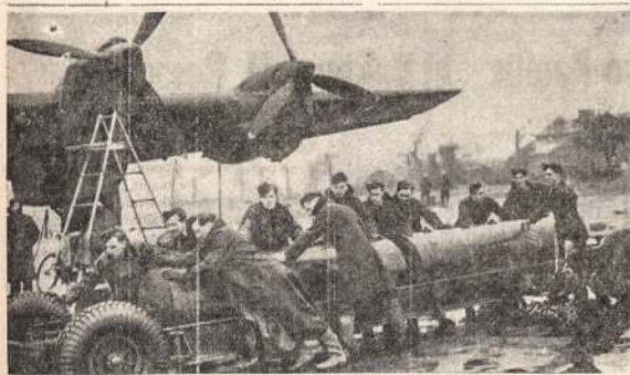
Orlaivininkai šiame stvaizde matomi pakraunant 8,000 svarų bombą. Tokios bombos dabar naudojamės bom-tu. Kada jį sprogs, tai išbardinam Hitlerio kariškies blokas subyra į šipufabrikų ir militarinių punktus.