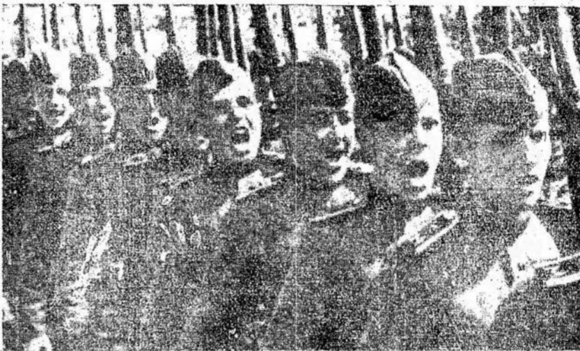
Raudonosios Armijos kariai eina į frontą su daina. Raudonarmiečių ūpas dabar la- hai pakilęs, nes jie jau bai- gia vyti priešą iš savo kra- sto. Ukrainos armijos jau i- žergė į Rumunijos teritoriją ir nuėjo virš 60 mylių į Ru- munijos žemę.

MEXICO CITY. — Armijos kapitonas norėjo nušauti prezidentą Kardačo.