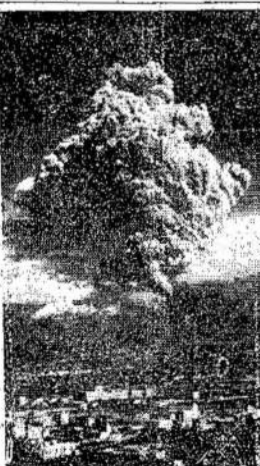
Italų kalnas Vezuvijus laike išsiveržimo, žiūrint iš Neapolio.