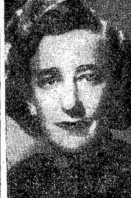
Miss Lillian Hellman