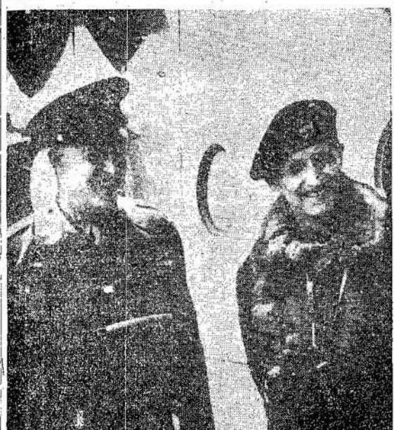
Generolas Eisenhoweris ir generolas Montgomerys šypsojasi reikšdami pasitenkinimą invazijos pasekmėmis. Jis čia matomi ant laivo vykstant į Normandiją.