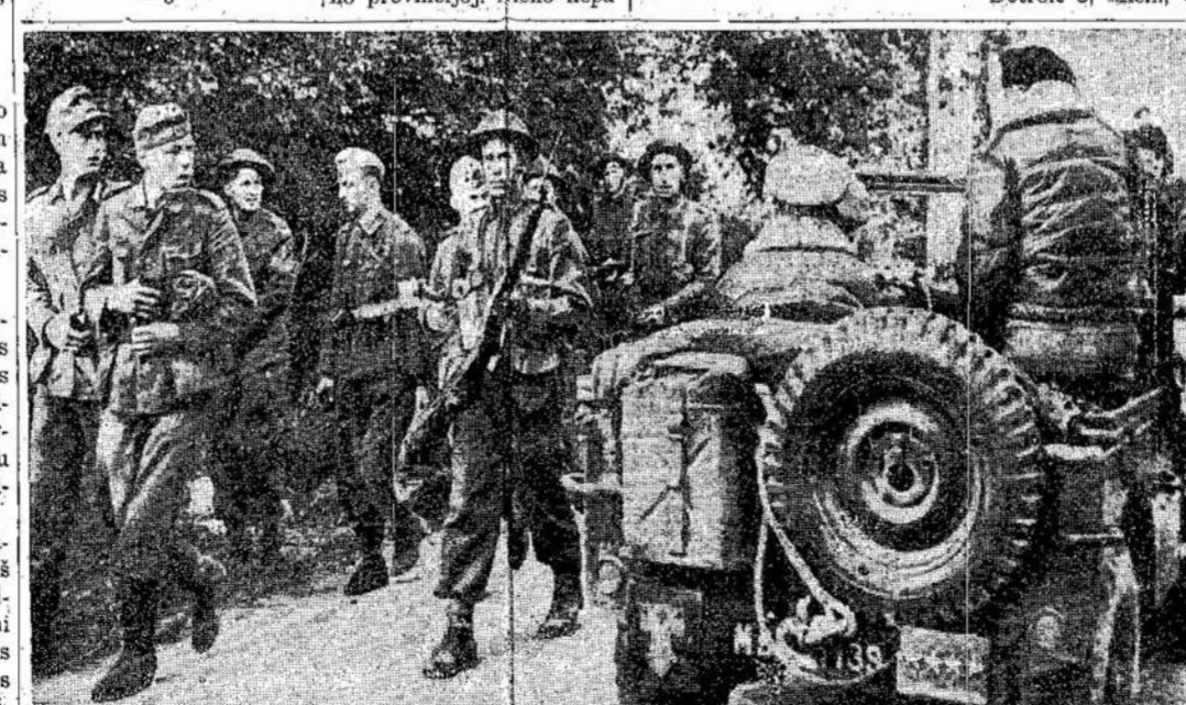
Vokiečių belaisviai akis išdint ant džipso, kur nors las Eisenhoweris, premjeras Ciorčilis ir net pats Britanijos karalius. Karalius apdovanojo kanadiečių trečios divizijos komandierių medaliu už gerą vadovybę.