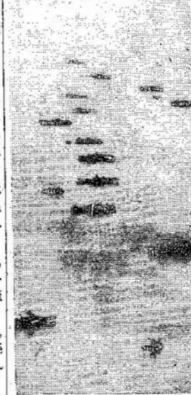
Cia matote mažā dalį to didžiulio laivyno iš 4,000 laivų, kuris ėmė dalyvumą in-

po tikrove: ofensyva prieš Vokietiją iš vakarų prasidėjo.