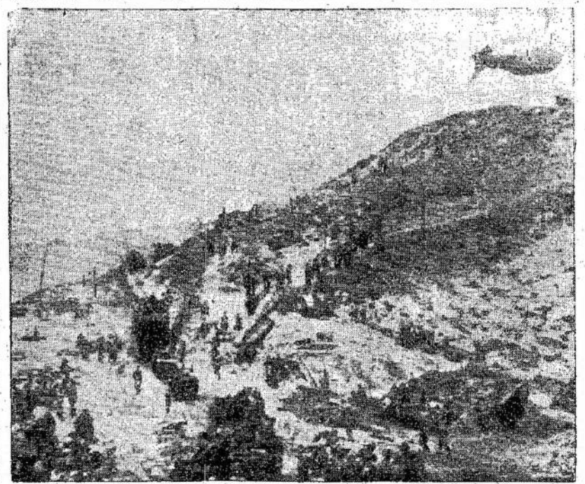
Sąjungininkų jėgos matomos sturmuojant vokiečių Normandijos pakrastyje. Krantas jau nuvalytas ir naudojami apsaugai nuo vokiečių orlaivių. Dabar jau mi visu smarkumu. Balfūnai arti pusės milijono iškelta.

Užėmę salę reikalavo, kad buvęs Montrealo miesto mąajoras Houde būtų paleistas iš internavimo kempės.