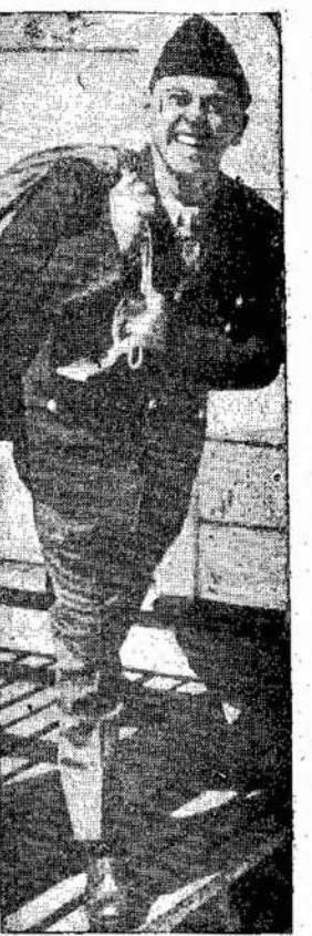
Pagarsėjęs Holivudo aktorius Mickey Rooney paimtas į kariuomenę. Čia jis matomas po užsivilkimo kariškų drabužių.

Iki 60 metų amžiaus visos liaukos turi eiti deramai pareigas, sako mokslininkas. Jis net daleidžia, kad nekuri žmonės gali gyventi 150 metų. Tai jau nepaprastai tvirtu subudavojimo žmonės. Bet 90 metų, tai turėtų būti bendras amžius. Jis turi formulą kaip gaminti tūla „serumą“, kuriam duotas vardas „ACS“. Šisai vaistas gerai veikia celių pagaivinimui. Daugelį ligų su juo galima gydyti. Tačiau nei kiek nepadaeda tokiom ligom, kaip cukrinė, vėžys, širdies nu-