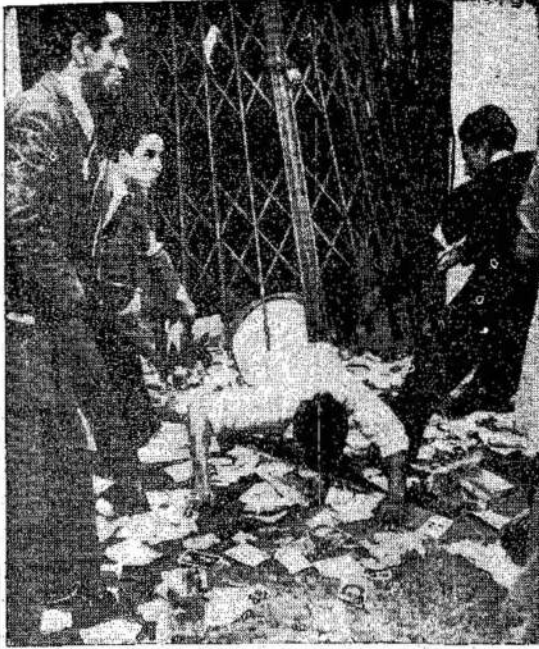
Romos antifašistai krapšo fašistų vadą iš slėptuvės. Tokių scenų Roņoj, sąjungininkų armijai užėmus, buvo gana daug. Antifašistai nedavė progos jiems išbėgioti.

Šioj naujoj Europoj, Suomijai buvo numatyta privilegijuota ir pelninga vieta grązon už jos pagalbą. "Vokietija užtikrino Suomijai taipgi ir žymią poziciją šioj naujoj Europoj," rasė Suomijos premjeras. Kaip viešai išsireiškęs agresinės tautos vasalas, Suomija dabar stovi prieš to viso pasekmes. - Toronto Daily Star.