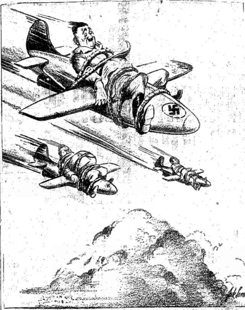
Toronto Daily Star karikatūristas vaizduoja, kaip vokiečiai galėtų panaudoti raketines bombas užbaigumui kario išgelbėjimui savo krašto nuo dar didesnių atakų, kuriomis bus neišvengiamos, jeigu vokiečiai to nepadarys greitu laiku.

Bet dabartiniu metu, mums rodo, subiręs visų Hitlerio bernų vilgys, kaip kad subirėjo suomių fortifikacijų linijos, ant kurių jie tiek daug rėmėsi. Fašizmo sunaikinimas garantuotas. Jutginės Tautos negrįž atgal, paklojusios tiek daug aukų. Kurjems dar užtenka sveiko senso, laikas būtų nors dabar atsikratyti pragaistingų minčių ir planų.