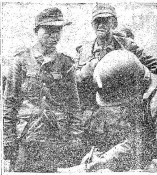
Sąjungininkai Normandijoje suėmė į nelaisvę, bet vokiečių, japonų, lenkų, lietuvių ir kitųjų fašistų, įstojusį į nacinių armiją. Čia matote japoną ir vokiečių apklauskėją.