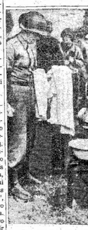
Generolas Eisenhoweris, invazijos komandierius, prausia si iš plūdo, laike apžiūrėjimo sąjungininkų pozicijų

Saulutė buvo ne tik patėkėjusi, bet spėjo pasiskotėti viršum žemesnių krūmų viršūnių. Vokiečių erzelis beveik visiškai aprimo. Gamta buvo tokia maloni, kad, rodos, staiga viskas turi pa-