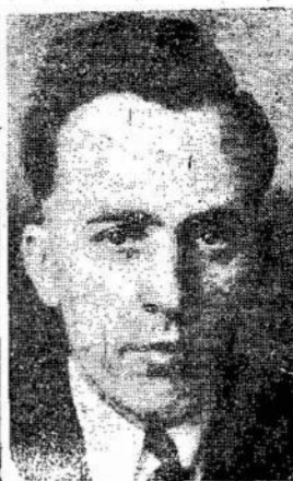
Rev. T. C. Douglas, Saskačevano CCF vadas ir busimas šios provincijos premjeras. Jo partija (CCF) laimėjo 47 vietos iš 52.