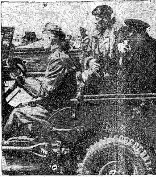
Sąjungininkų frontą aplankė Ciorėlis. Čia jis matomas su Britų premjeru Vinstonu Čerčilu ir generolu Montgomery.

Konferencija taipgi priėmė rezoliuciją, raginančią valdžią, kad pripažintų Fran-