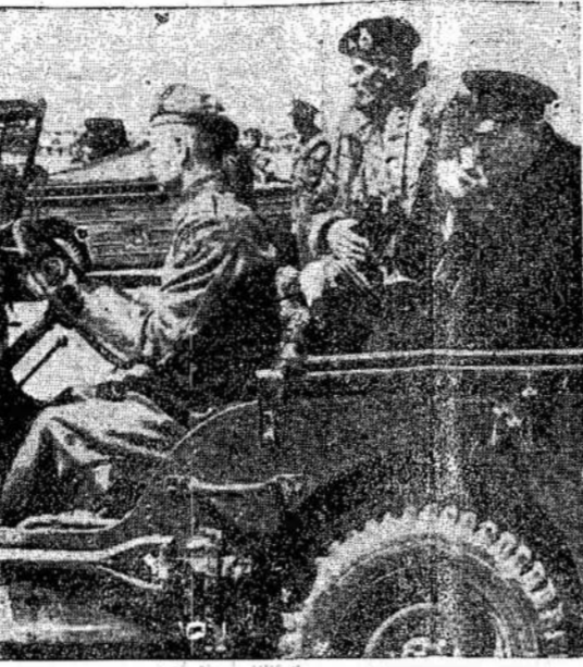
Sąjungininkų frontą aplankė Ciorilis. Čia jis matomas su Britų premjeru Vinstonu generolu Montgomery.