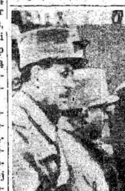
Generolas De Gaulle (vidury). Francijos išlaisvinimo jėgų vadas, aplankė savo kraštą ir kalbėjo į savo tau-

Lietuviškos vienutės Raudonoj Armijoj kovojo didvyriškai. 1941 metais, ties Velikije Luki ir Toropecu, uždavė vokiečiams vieną smūgį po kito. Tose kovose daugelis lietuvių komandieriu ir kalbėjo į savo tau-