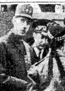
tičius Bayeux miestelyje. Jis buvo patiktas su gėlimis ir patriotinėmis dainomis vietinių gyventojų.

Vokiečiai norėjo išnaikinti lietuvius ir paversti Lietuvą į kraują permerktą dykumą. Bet kietas Lietuvos žmonių kargas neatšipo ir naikina savo užkariautojus. Lietuvių pajėgia vesti šitą pergalingą karą už tai, kad su jais yra kovingi ir dilinšė akyse.