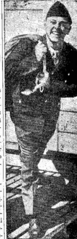
Pagarsėjęs Holivudo artistas Mickey Rooney paimtas į kariuomenę. Čia jis matomas po užsilvinkimo kariškų drabužių.

Iki 60 metų amžiaus visos liaukos turi eiti deramai pareigas, sako mokslininkas. Jis net daleidžia, kad nekurie žmonės gali gyventi 150 metų. Tai jau nepaprastai tvirtu subudavojimo žmonės. Bet 90 metų, tai turėtų būti bendras amžius. Jis turi formulą kaip gaminti tą „serumą“, kuriam duotas vardas „ACS“. Šisai vaistas gerai veikia celių pagaivinimui. Daugelį ligų su juo galima gydyti. Tačiau nei kiek nepadaeda tokiom ligom, kaip cukrinė, vėžys, širdies nu-