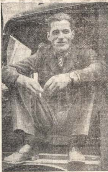
Sparno komandierius Johnny Johnson, D.S.O. and Bar, valgo šokoladą liuoslaikiu. Jis yra nu-

Prezidentas Ruzveltas yra geras draugas mūsų šalies. Kanados. Jis sutelkė didelę pagalbą Britanijai ir Sovietų Sąjungai. Jis pamirštasi ir Kinijos. Jis aukštai pakėlė Amerikos vardą visame pasaulyje. Visi demokratai su nekantrumu lauks, kad jis būtų išrinktas prezidentu dar vienam terminui, jei ne daugiau.