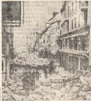
Kanados pėstininkai traukia Caen gatvę. Į kį paverstas Caen miestas galima aiškiai matyti. Vokiečiai gynė šį