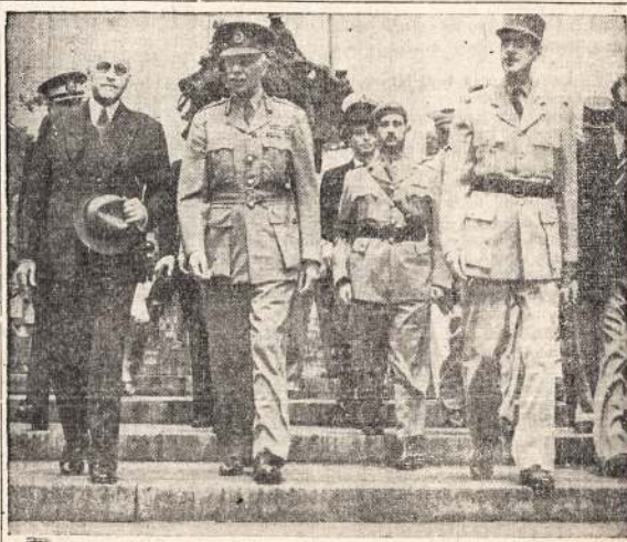
Generalas De Gaulle, Prancūzų Tautinio Pasiluosavimų Komiteto vadovas, neseniai lankėsi Amerikoje ir Kanadoje. Kaip Amerikoje, taip ir

Tuo pačiu kartu buvo įrodymas, jog Raudonoji Armija tikrai sudarė skaudžius smūgius Hitlerio pajūjom. Belaisvių vokiečių suvė vien per praėjusias tris savaites buvo suminta virš 100,000 vokiečių. Belaisvinis, užėmėtais ir užmūstais naciai per tą laiką neteko 500,000.