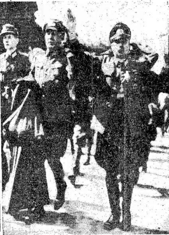
Aukšti vokiečių karininkai baigė jų siautimo dienas. Turaromi Paryžiaus partizanų belaisvių stovykla. Pasirės pasėdėti kempese iki karas pasibaigs.