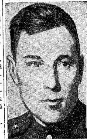
Sovietų Sąjungos didvyris, pulkinikas Pokrykin, numušęs 59 vokiečių orlaivius. Jis laimėjo Sovietų herojaus titulą tris kartus.

Tuo pat laiku vokiečiai neteko 3,545 orlaivių. 1,028 orlaiviai buvo sugadinti. Taipgi vokiečiai neteko 1,300 tankų, 20,000 motorinių vežimų ir daugybės kitokių įrankių ir amunicijos.