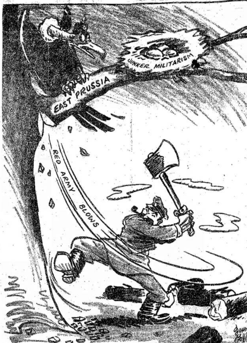
DAR KELETAS KIRČIŲ IR BUS PAKIRŠTA

Jeigu balsavimai į federalį parlamentą pasektų provincijalius balsavimus, tai sekantis federalis parlamentas susidės iš stambių įvairių partijų grupių ir veikiausiai nei viena partija negalės turėti daugumos be susidėjimo su kitomis partijomis. Dviejų partijų sistema Kanadoj atrodė išėina iš mados.