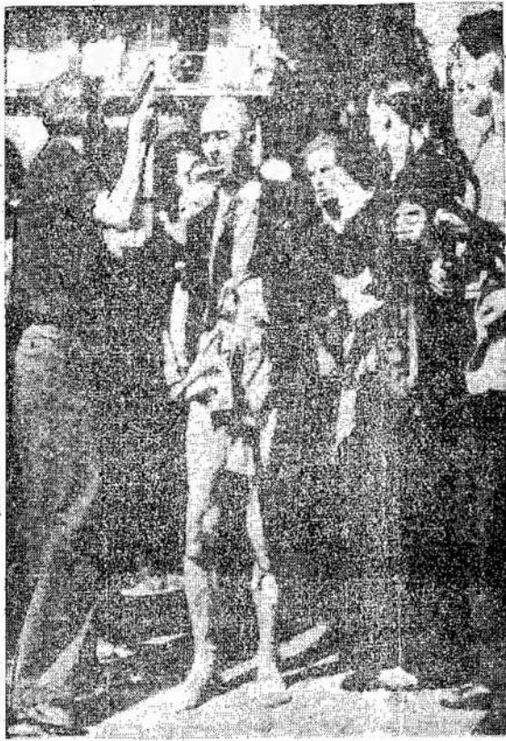
Įpykę paryžiečiai nutraukė kelines nuo šio Hitlerio bendrašarbio ir nežinia, kas su juo būtų atsitikę, jeigu partizanai nebūtų sulaukę ju. Bet jis nuo bausmės neištrūks. Francūzų teismas uždės užtarnautą bausmę.