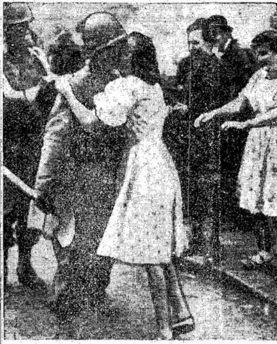
Francūzės bučiuoja sąjungininkus. Laivintojai panaikinti pasitinkami visur, kur tik įeina vydomi vokiečiai.

Jis stoja už visų žmonių vienybę ir pasirengęs sekan-