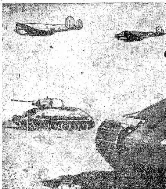
Sovietų tankai ir orlaiviai lenktyniuojas mušdami priešus. Jų pagalba, raudonarmiečiai uždavė priešui baisius smūgius ir išvijo iš plačių žemės plotų. Jie daugiausiai atsakingi ir už Rumunijos pasikeitimą.

NEW YORK. — Britų radio pranešė, kad Bulgarija kreipėsi prie SSRS dėl pasirašymo paliaubų.