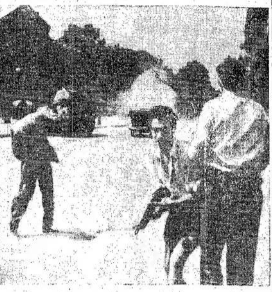
Scena iš paryžiečių kovų laiku Paryžiaus laisvinimo. Paryžiečiai buvo prastai ginkluoti, bet buvo taip gerai organizuoti, kad net tankus nugalėjo.

LONDON. — Amerikiečių šarvuotos jėgos jau įsiveržė į Vokietijos teritoriją ir kova eina jau apie 10 mylių nuo rubežius vidų Vokietijos. Įsiveržimas įvyko į šiaurę nuo Triero miesto, kuris liko šone; ir į pietus nuo Aachen. Tuo pat laiku Maskvos radio pranešė, kad Raudonosios Armijos priešakinės dalys įsiveržė į Rytų Prūsiją. Nepaprastai didelės kovos eina dėl Lomžos, netoli Rytų Prūsijos, kuri skaitoma virtuvokiečių punktu, stovint ant kelio į Rytų Prūsiją. Generolo Crear vadovaujamos Kanados Pirmos armijos jėgos išlaisvino didelį francūzų uostą Le Havre. Suėmė 5,000 vokiečių, kurie gynė Le Havre. Le Havre prieplauka bus labai reikalinga sąjungininkams dėl iškelimo daugiau jėgų ir reikmenų.