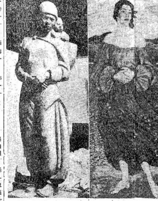
Kanados Sovietų Draugis-kuo Nacionalis Komitetas siunčia Sovietų Sąjungon kelis šimtus piešinių ir 60 skulptūros kūrinių. Čia matote tris iš jų. Tai "Eskimo Mother and Child" (kairėje) ir "Goalkeeper" (dešinėje), abu Francis Loringo kūrinių. Viduryje — piešinys, "Benedicta", R. S. Hewtono kūriny.

tas ir 3 geležkelio stotis. Veržiamosi linki Lietuvos rubežias, divizija sunaikino apie 20,000 hitlerininkų ir suėmė nemažai belaisvių ir ginklų.