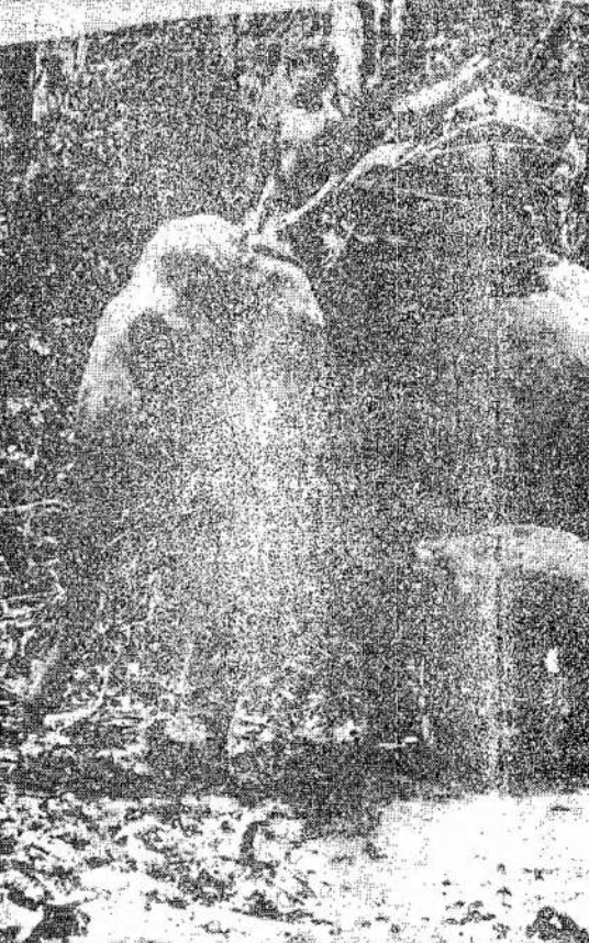
Burmoje ne visur galima naudoti trokus ar automobilius, todėl kartais tenka panaudoti net dramblius pristatymui amunicijos ir reikmenų. Čia matote burmietį gabenant reikmenis ant dramblio nugaros.