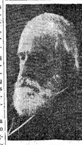
Sir William Mulock, kuris spalio 1 dieną mirė sulaukęs virš 100 metų. Ateinančiais metais sausio 19 būtų buvę jam 102 metai. Jis ilgą laiką buvo Ontarijos vyriausiuoju teisėju.

Iki šiol samdytojai visai išsisukinėjo. Kada unija atsikreps į vietos įmones vedėjus, tai jie aiškinosi, kad