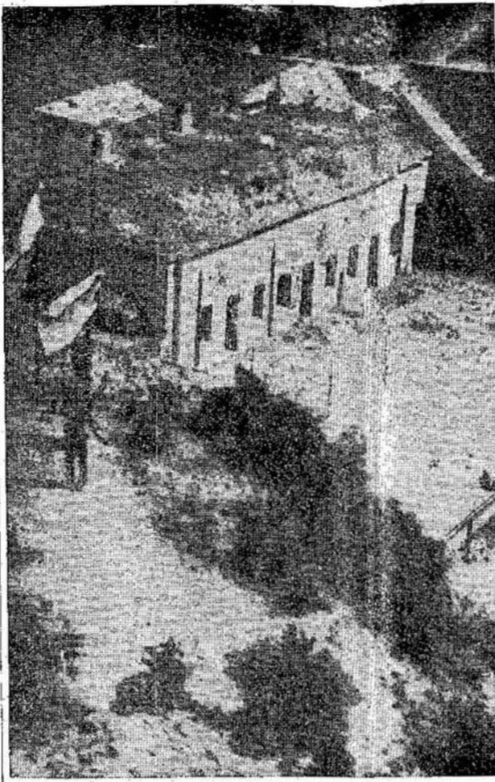
Nacių kareivis su balta vėliava prie forto praneša sąjungininkų kareiviams, kad jie pasiduoda. Šis fortas prie Quincy miestelio laikėsi labai ilgai. Paveikslas nuimtas iš orlaivio, kuris davė direktyvas žemės kovotojams.

Jeigu Francijos ir kitų kraštų valdžios galėjo susitarti su partizanais ir kitokiais judėjimais ir sudaryti vieningas valdžias, tai gali padaryti ir lenkai, tik reikia nekurstyti ir neužstoti jų.