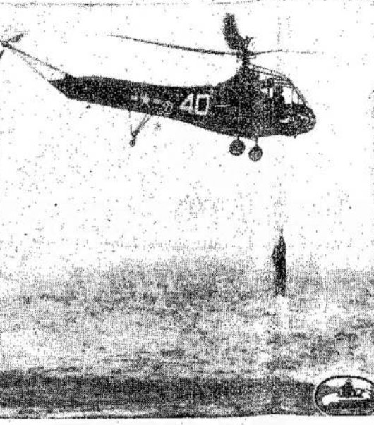
Helikopteris demonstruoja savo naudingumą gelbėjimui jūrininkų arba orlaivininkų iš jūros. Kybodamas viršū jis gali užtraukti pas save po vieną. Jeigu vanduo neramus ir orlaivini nusielti negalima, vistiek helikopteris gali paimiti ir tokiu būdu išgelbėti.

Washingtonė tik ką pasibaigė tarpe Amerikos, Sovietų Sąjungos ir Anglijos konferencija, kurios tikslas buvo apsvarstyti ir išdirbti planus, kaip ateityje išlaikyti taiką, tai Dumbarton Oaks Konferencija. — Laisvė.