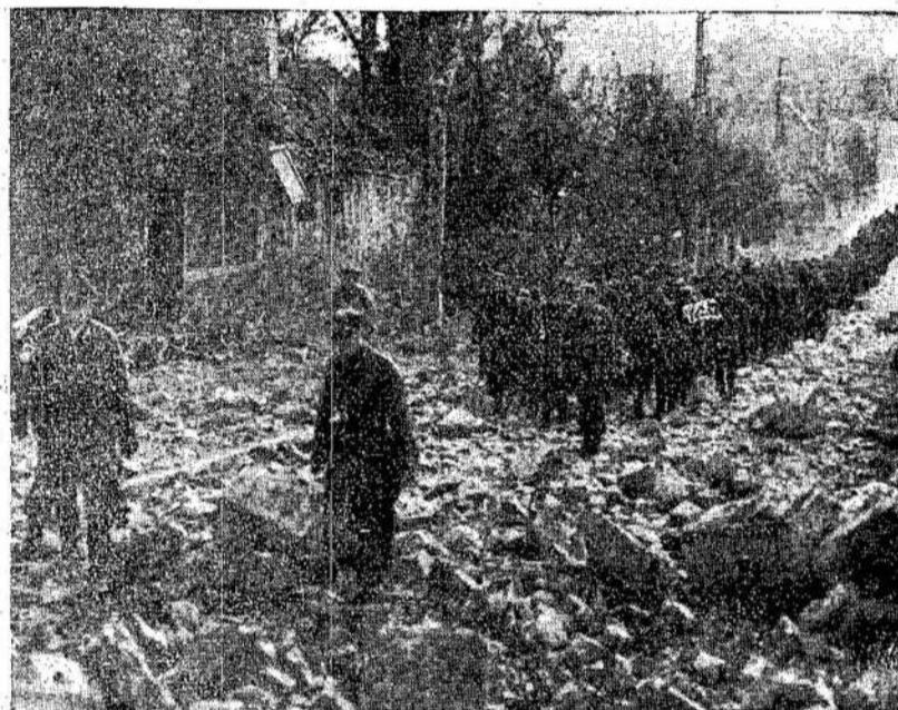
Vokiečiai belaisviai su savo komandieriais priešakyje maršuoja į belaisvių kempę su prielauka Francijos pa-

Norintieji-paaukoti kraujo, telefonuokite: MI. 2453. Gausite visas informacijas.