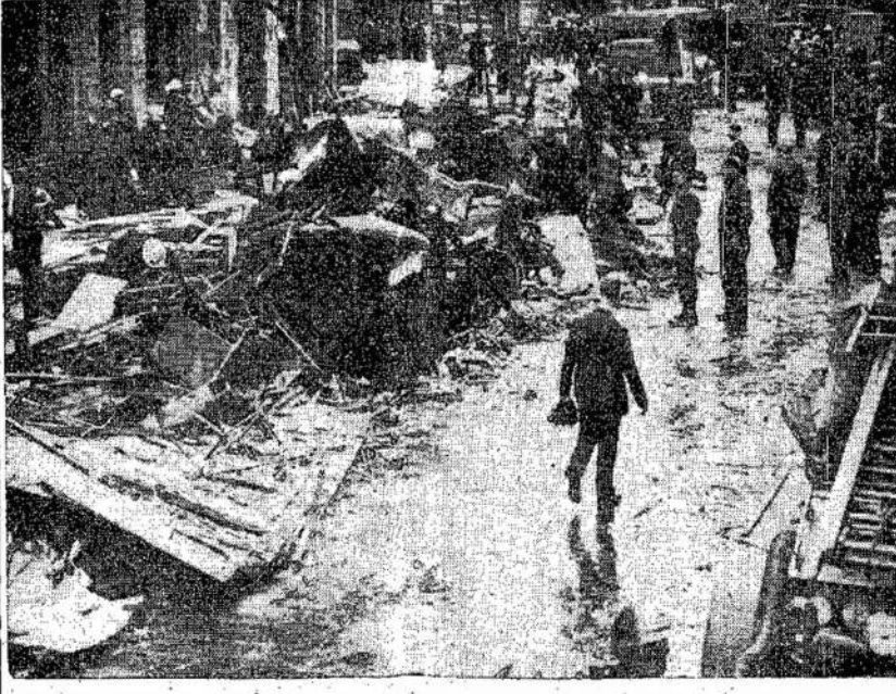
Si scena parodo, ką nacių bombos padarė Londonui. Čia matote Kingsway sekciją, užverstą busų, automobilių ir namų griuvėsiais. 2-300 robotinių bombų nukrito ant Londono. Jos sugriovė arba sugadino virš milijono namų.

Grumojimais ir persekiojimais vokiečiai bandė sukelti įspūdį, kad jie vysto meno darbą.