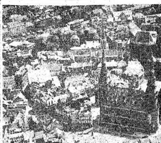
Tai vokiečių miestas Aachen, kuris pirmas iš stambesnių vokiečių miestų labai nukentėjo. Neciams atsisakius pasiduoti, ant jo buvo paleista artilerija ir šimtai orlaivių. Visiems vokiečių miestams bus taip, jeigu naciai nepasiduos. Paveikslas buvo nuimtas pirm karo.

Čia yra manoma, kad Hungarijoj dabar eina tarpusavė kova tarp Horthy ir Shali šalininkų.