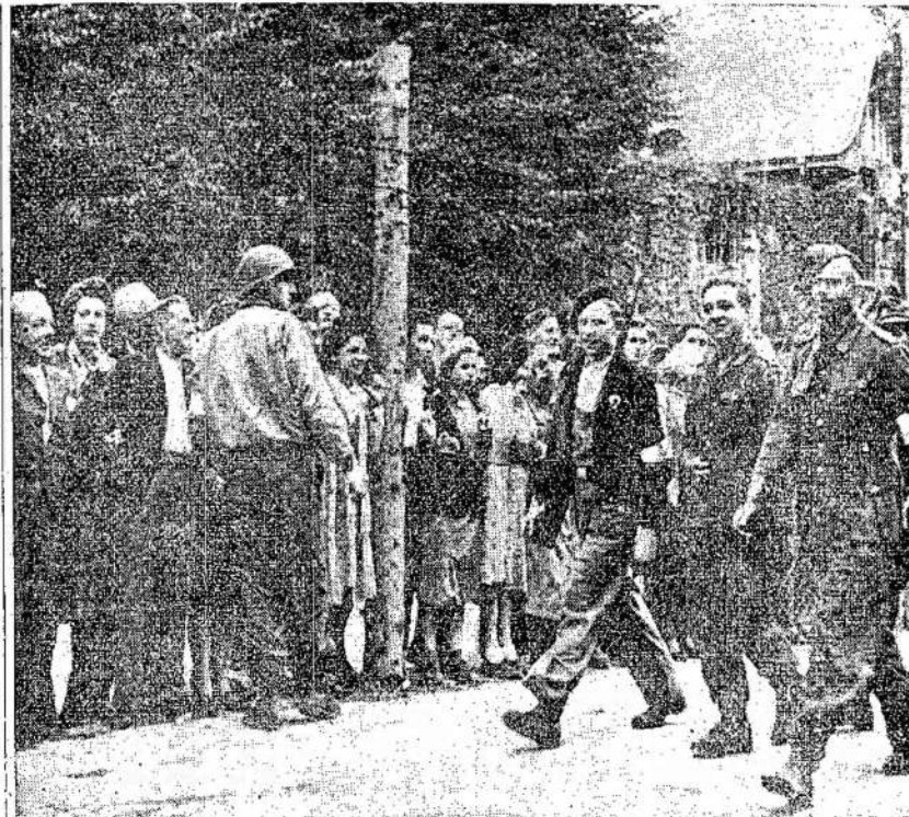
Internautieji su pasitenkinimu žiūri, kaip jų saugotojai naciai varomi į belaisvių Jungtinių Tautų piliečiai po to buvo išleisti iš kempės, kuri buvo aptverta spygliuotomis tvoromis.