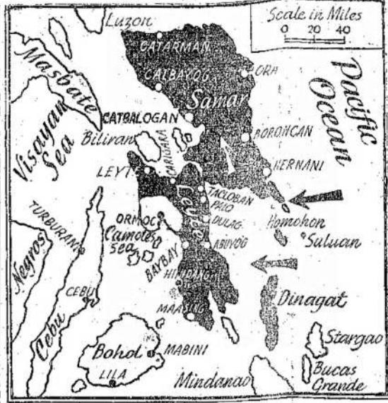
Šis žemėlapis parodo amerikiečių atkovotas salas Filipinuose. Kaip matote, Samaros sala jau visai išvauduota.