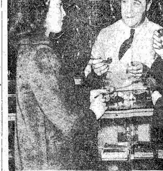
Kada Jungtinės Valstijos pasireiškė cigarečių stoka, tai nekuriuos "praktiškos" amerikietės kreipėsi prie pykčių.

nuosirdžiausiai dėkoja Raudonajai Armijai, kaip išlaisvintojai, ir visiems Sovietų Sąjungos žmonėms, o ypatinai didžiajam vadui ir mokytojui Stalinui. Lietuvos žmonės labai dėkingi savo didžiajai sovietinei tėvynei ne tik žodžiais, bet ir darbais.