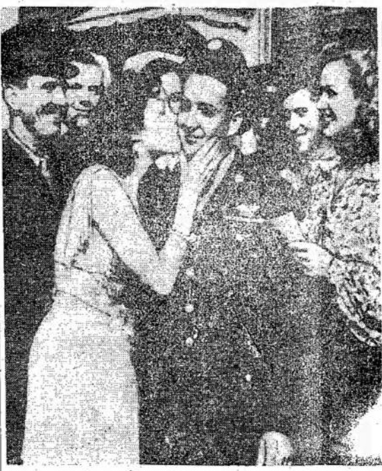
Holivudo artistė Yvone de Carlo, vancouverietė, turėjo pabūtuoti 50 kareivių, kaip pabaudą, kada jos kandidatas Dewey pralaimėjo. Ji čia matoma būduojant pirmą iš 50, kuriuos ji turėjo pabūtuoti.

Atsisveikinau su savo lenkais bičiuliais, o jie įspėjo mane, kad būčiau atsargus, kad nebūčiau apiplėštas. "Nesirūpinkit," tariau jiems. "Aš stengsiuos būti atsar-