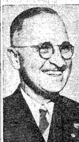
Buvęs senatorius S. Truman, naujas Jungtinių Valstijų viceprezidentas.

ma yra verta tiek, kiek turėjo vertės 50 bilijonų drachmų senųjų. Kitaip sakant, graikai už savo senus pinigus gaus tikrai po vieną drachmą už 50 bilijonų senųjų drachmų.