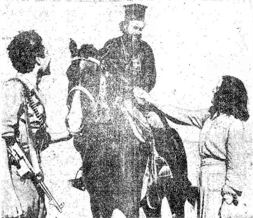
Graikų stačiatikių kunigas na moteris iš jo parapijos už jo puikų darbą prieš nacius. Kairėje stovi vienas iš jo va-dovaujamy partizanų. Graikai nelaukė, kad juos kiti išvaduočiau.

Numatoma viso paleisti iki 10.000 orlaivinių.