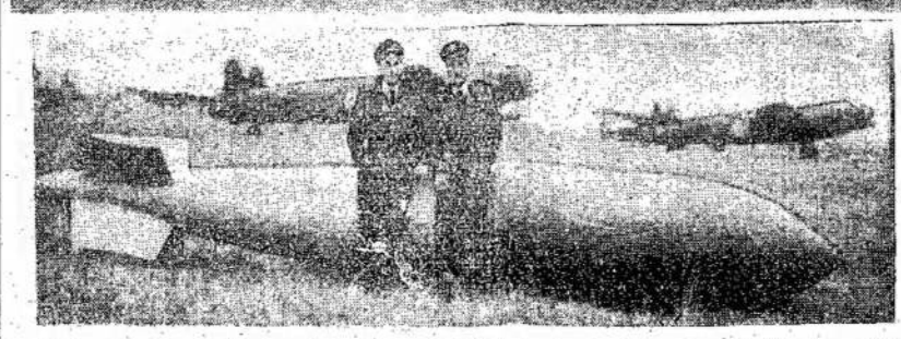
Viršuj garsusis vokiečių ka-ro laivas Tirpitz, kurį britų ir kanadiečių bombieriai nu-skandino. Apačioj — bom-bieriai, bombos ir du lakūnai iš eskadrono, kuris nuskan-dino tą vokiečių jūrų vilką. Naciai gyvėsi, kad Tirpitz yra nenuskandinamas.