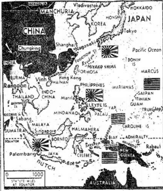
Šis braižinys parodo, kaip japonai kerta nemažas kinų jėgas nuo visos Kinijos. Juodas plotas yra Čiangkaišeko kontrolė, o balti plotai japonų.