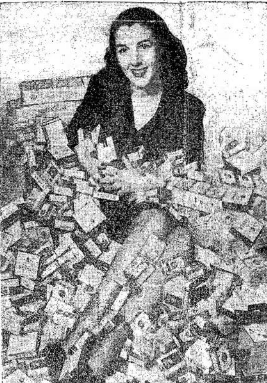
Si mergina demonstruoja, per mėtus, jeigu jūs surūko-kiek cigarečių jūs surūkote te po tris pakelius į dieną.

Beje, CCF spauda sako, kad jeigu Cjangkaišektas nesu-si vienys su komunistų vadovaujamomis jėgomis, tai Kinijai bus sunku atsilaikyti. Bet apsiukę visom keturiom spardosi nuo koalicijos su liberalais namie. O be tolios koalicijos bus sunku apgalėti atžagareivius.