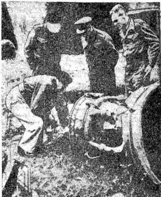
Marsšalas Sir Bernard L. Montgomery ir kiti britų karininkai žiūri į vokiečių raketinę bombą V-2 kur nors Belgijoje. Nors šios bombos sprogstą labai smarkiai, bet matyti kai kada išlieka išsios dalys nesudraskytos.

Generolas De Gaulle, apleisdamas Sovietų Sąjungą, pasakė gražią kalbą, pareikšdamas mintį, jog jo atsilankymas į Maskvą bus istorinis įvykis. Ant galo dėdėjo: "Lai gyvuoja Sovietų Rusija!"