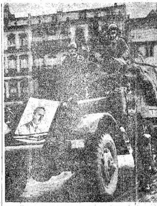
"Hitleris" važiuoja į frontą. Francūzai užsėdė ant troko priešakio Hitlerio paveikslą traukia į Strasburgą. Naciai mykėjo Hitlerio paveikslus ir visur jų buvo pilna, bet sąjungininkai juos išrankioja ir sunaikina. Šis Hitlerio paveikslas irgi susilaukė tokio pat likimo.