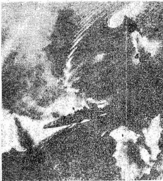
Cia matote didžiulį japonų skandintą. Japonai neteko orlaivianėšį laike amerikiečių užpuolimo. Jis bandė išsisukti, bet vistiek buvo nu-

Amerikiečiai yel išsiuntė didelį siuntinį. Jie tęsia tą darbą be sustojimo. Ir juo toliau, tuo daugiau lietuvių pamato, kad Lietuvai Pagalbos Teikimo Komitetas yra vienintelė organizacija šiuo tarpu, per kurią galima paremti Lietuvos žmones.