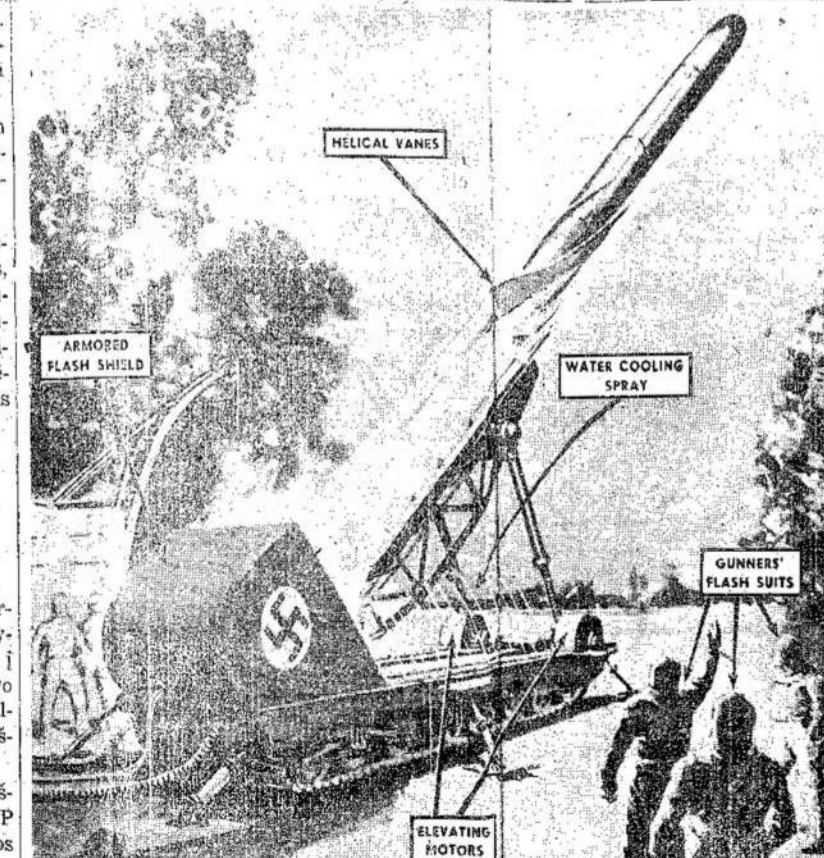
Šis piešinys vaizduoja pieštą įsivaizdinimą, kaip vokiečiai paleidžia savo V-2 raketą.