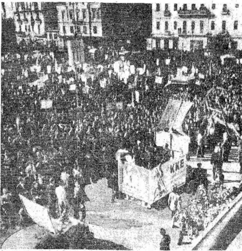
Didelė minia žmonių Atėnuose, Konstitucijos aikštėj, laike minėjimo 26 metų sukaktuvių, kaip įsisteigė Graikijos Komunistų Partija. Komunistų įtaka Graikijoje sakoma nepaprastai didelė, bet jie sudaro tikrai 10 nuošimčių to judėjimo, kuris dabar priešinasi britų intervencijai. Su intervencija eina tiktai monarchistai.

Kitose Ontarijos vietose irgi buvo tas pats.