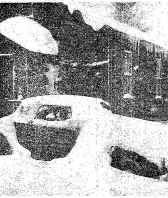
Torontas susilaukė sniego tiktai šiomis dienomis. Tuo tarpu kitose Ontarijos vietose užėjo daug anksčiau. Štai vaizdas iš Camp Borden,