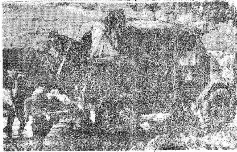
Kanados pėstininkai, atvykę į atakos vietą šarvuotu automobiliu, skubotai šoka laukan ir bėga į savo pozicijas. Vokiečių atkaklus priešinimasis ir kontrofensyva reiškia sunkias kovas ir del kanadiečių. Bet jie savo pareigas atlieka gerai.