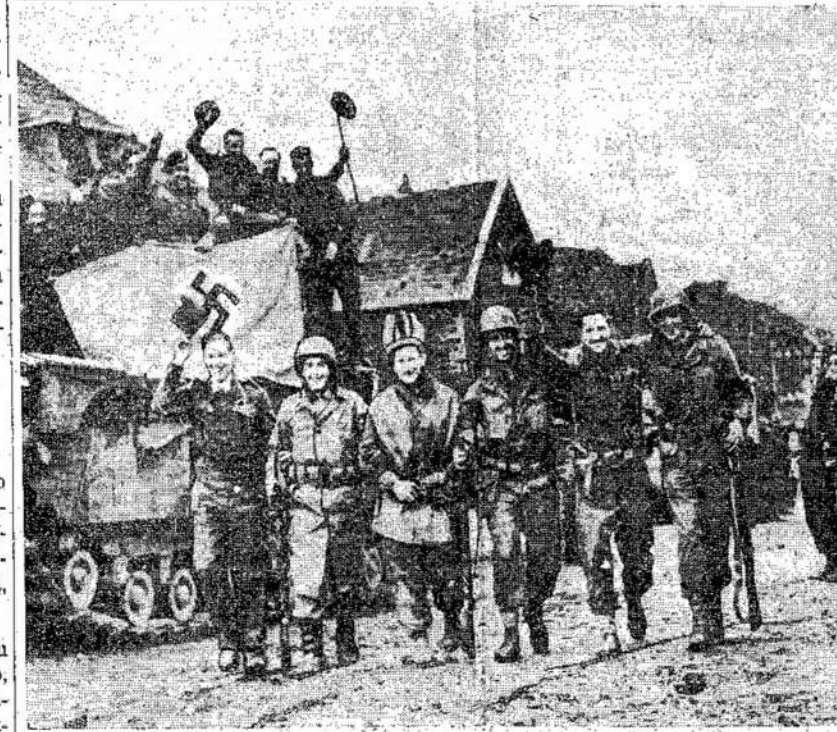
Britai ir amerikiečiai demonstruoja savo pasitenkinimą užėmus vokiečių miestelį Geilenkirchen. Vokiečiai m