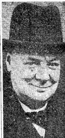
Britų premjeras Vinstonas Čiorčilis, kuris pribuvo į Atėnus taikymui graikų. Pašitai buvo padėję po viešbučių dinamičią ir norėjo nužudyti jį.

Londoniškė valdžia rezignuosianti, o jos vieton bus sudaryta nauja, su didele atstovybe nauj partizanų. Jis sako, kad partizanai turi teisę tarti didelį balsą naujoj valdžioj.