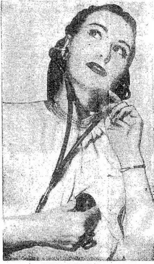
Tikėtis, ar ne, bet žmogaus natra, tuomet ji muša dar greičiau. Ši mergina bando skaičiuoti savo širdies mušimą, sakysime merginoms Si-

Smetonajai, kada tik siūnia kur rezoliuciją, visuomet kalba 11,000 lietuvių vardu. Tuo tarpu jie neatstovauja nei 200 organizuotų Kanados lietuvių. Visa laimė tame, kad jie tik tiek ir tegali — šaukti, kiek jie atstovauja.