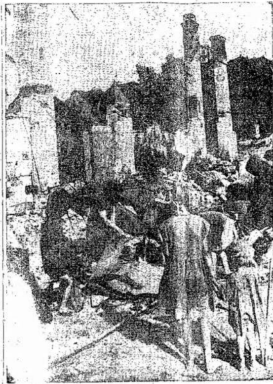
Lithuanian children near the destroyed homes in Kaunas, Lithuania. They were forced to live in German-occupied territory.

Doctor: — Only members of the family may see him. Are you a relative? Girl: — Oh, yes, indeed. I'm his sister. Doctor: — So glad to meet you. I'm his father.