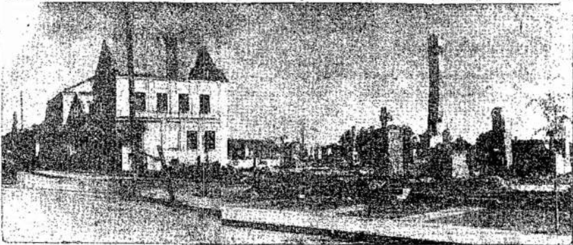
Kai kurie Lietuvos miestai švenčionių miesto vaizdą. Matyti vien grūvėsius. Štai kodėl dabar taip svarbu palaikyti Lietuvą.