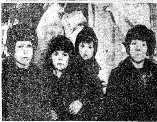
Cia matote keturius Hol-ditchų (torontiečių) vaikus, iš kurių trys žuvo nuo gesu, kurie kažkaip ištrūko iš

TRAKAI. — Šiame apskrityje jau veikia 164 pradžios mokyklos, 7 progimnazijos ir viena gimnazija, taipgi viena mokytojų seminarija. Netrukus pradės veikti 12 knygynų ir 17 klubų-skaityklų.