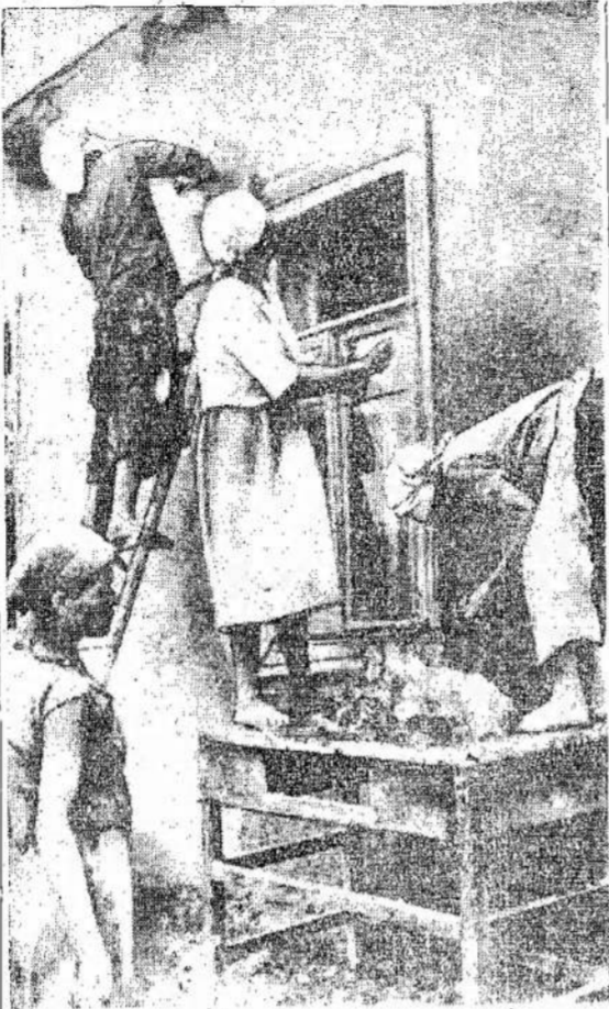
Sovietų kolektyvistes taiso vokiečių apgriautą namą Ukrainoje. Vyras išėjo kariuotei, buvo visai sunaikinta ir nekalbina sumušti priešais.

Sovietų kolektyvistes taiso vokiečių apgriautą namą Ukrainoje. Vyras išėjo kariuotei, buvo visai sunaikinta ir nekalbina sumušti priešais. Šis namas bus panaudotas mokyklai, nes mokykla buvo visai sunaikinta ir nekalbina sumušti priešais.