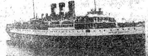
Kanados didlavis Princess Marguerite, kurį priešas nukandino Viaržemio jūroj 1942 metais, rugpiūčio 17. Cenzūra tik dabar leido paskelbti nelaimę.