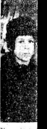
Cia matote ditchų (toro) iš kurių tryš... kurie kažk...