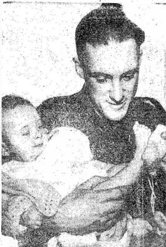
Šio Kanados veterano karo bėdos užsibaigė, bet tuomet kartą prasidėjo namų fronto bėdos. Tai šeimos problemos. Jo žmoną užmušė Anglijoj vokiečių robot-bombos. Dabar jam tenka išmokyti auklėti savo sūnelį. Čia jis matomas maunant sūnui "deveryką."