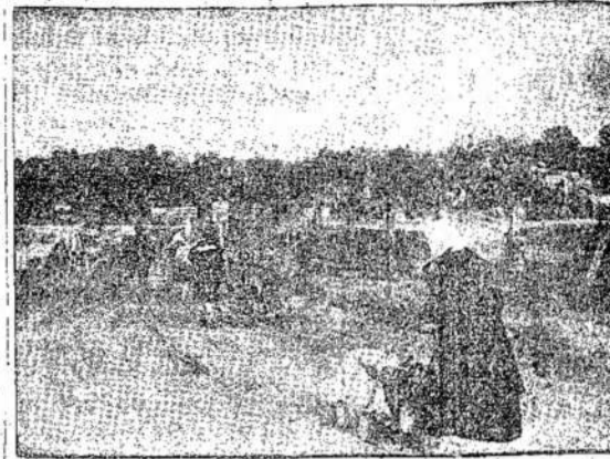
Scena iš Lietuvos: valstiečių scenų buvo tūkstančiai. Dailiai grįžta į namus, raudonagalvis sugrįžę neberado savo armiečių išlaisvintus. Tokių namų.