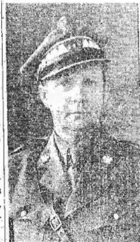
Generolas Rola-Zymierski, Lenkijos armijos viršininkas. Jis taipgi eina apsigynimo ministerio pareigas.

LONDON. — Sir John Anderson, finansų ministeris, pranešė, kad Anglija išleids karui po $64,125,000 į dieną arba po $23,625,000,000 į metus.