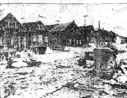
Scena iš Adučiskio miestelio, kietųjų susprogdintas. Šiame puikiausiai tai paliūdyja, ką atvaizde matomi griūveliai naciai padarė.

Parengimų komisijon iš- rinkti J. Kukenis, Skardžius ir J. Petrauskas. Visi trys jauni, energingi nariai ir tu- ri patyrimo tame darbe. Rei- kia tik nariams kooperuoti su jais. Taipgi nutarta susirinki- mus turėti sekmadieniais. Tas duos progą didesnam narių skaičiui dalyvauti susirinkimuose. J. U.