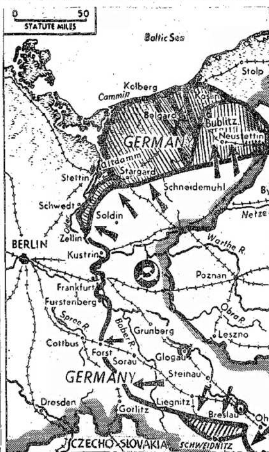
Sis žemėlapis parodo vėliau Raudonosios Armijos laimėjimą Pomeranijoje. Pasiekdama Baltijos jūrą, Raudonoji Armija užsitikrino savo dešiniąją sparną ir dabar gali veržtis ant Berlyno, nacių sostinės.

Suimtųjų tarpe yra ir vienas iš konservatyvų, kurie sudaro opoziciją dabartinei valdžiai.