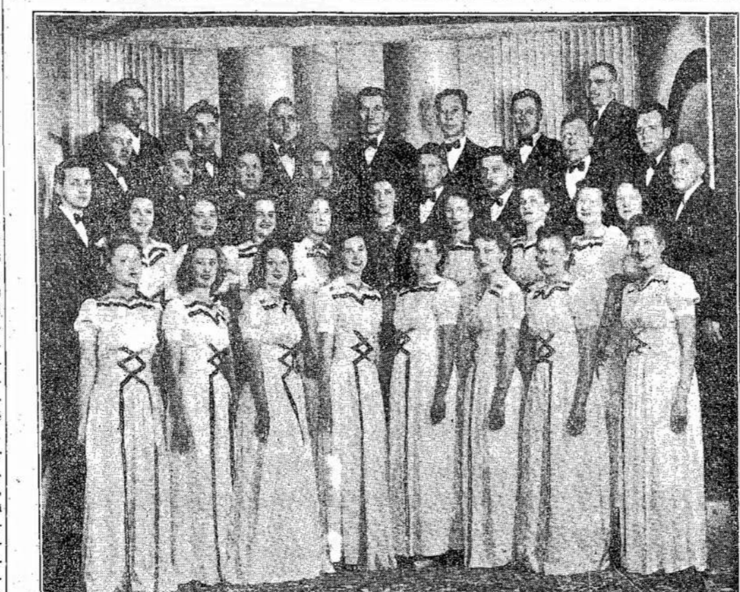
Bangos choras, kuris šį šeštadienį perstotys gražią operetę. Čia jis matomas senoj uniformoj. Operetėj jis bus apsirėngęs naujais gražiais tautiniais kostiumais. Perstotys mas įvyks 404 Bathurst St. salėj

Daugmėningi tyrinėjimai prirodė, jog kad ir nedidelis anglies viendeginio (carbon monoxide) kiekis žymiai užkerta deguoniui kelią į kraują. Mažina kraujo gaubumą sugert ir išnešiot po kūno audinius įkvėpotą oro deguonį, o dėl to pavojingai sumažėja smagenų veikimas didelėse aukštumose. Lakūnas nebeistengia taip gerai įmatyti akim ir taip mikliai susiorientuoti.