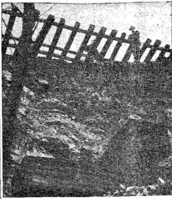
Upei išplovus vandenį iš po gan smarkiai, tačiau nevirto. Čia matote tą vietą, tavos upę gatvėkaris su 50 žmonių. Gatvėkaris parkrybū būtu žuvę daug žmonių.

Tą patį galima pasakyti ir apie jų šalininkus Europoje. Tokie kaip Arciszewskis, Vaino Tanneris, Papandreou (grekas) atkakliausia ir fanatiškiausia laikosi savo senose pozicijose. Jie, šiuo tarpu, sudaro reakcijos avangardą. Jų prospektai tolygūs hitlerininkų prospektams, kurie remiasi viltim, kad Tarkininkų tarpe pakriks vieny-