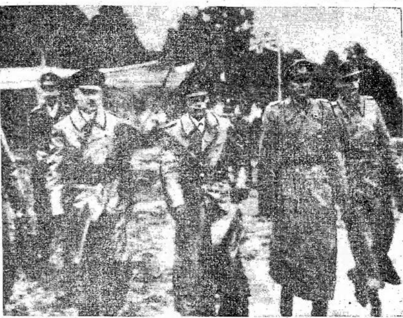
Čia matote grupę vokiečių karininkų, kurie sudarė vokiečių delegaciją, kuri pasirašė pasidavimo akta už vokiečių armijas šiaurvakariuose atsikimuose pasidavimas buvo besalyginis. Naciai turėjo priimti padiktutas sąlygas.

BERLYNAS. — Reporteriai, kurie čia buvo laike pasirašymo pasidavimo akto sako, kad Berlynas sugriautas taip, kad vargiai bus galima atstatyti jį.