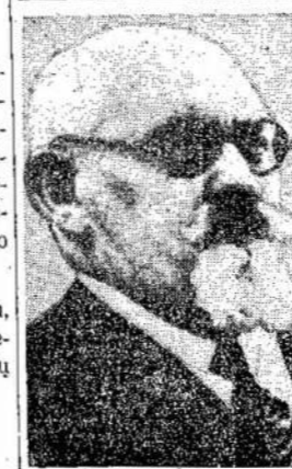
Dr. Karl Renner, buvęs Austrijos kancleriu 1919-20 metais. Jis dabar stovi priešakyje Austrijos laikinosios valdžios, kuri buvo sudaryta kelios dienos atgal. Jis yra socialdemokratas.

Mobilizavimas jaunimo kariškam lavinimui jau sulaukytas.