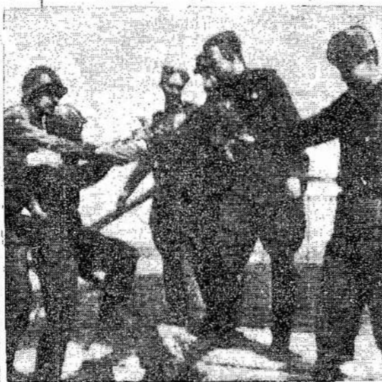
Raudonarmiečiai ir amerikiečiai sveikinasi susitikę prie Elbos upės, Vokietijoje.

Tie patys pranešimai sako, kad rusai surado po komandierių, ir feldmaršalų riuose buvo įtaisyta Hitlerio slėptuvė. Toji slėptuvė esanti giliai žemės iškasta, stipriai cementinėmis sienomis sutvirtinta. Ji susidedanti net iš kelių aukštų ir moderniškai įrengta, kad Hitleris galėtų jaustis saugiai ir pa-