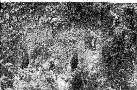
Amerikiečiai artinasi prie japonai atkakliai kovoja, o ant salų jie turi daug gamtinių skerspinių, kurios jiems tarnauja apsigynimui.

Taiigi, būt gerai, kad pats žmogus daugiausia rūpintųsi apie save ir savo gyvenimą, nesinervuodamas dėl mažniekių.