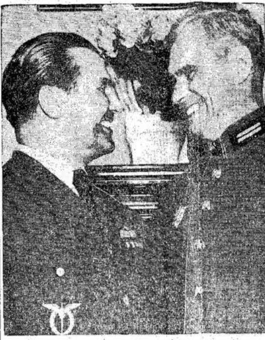
Sovietų Sąjungos ambasadoriaus Ottawoj buvo surengtas paminėjimas pergalės Europoj. Jame dalyvavo visų šalių diplomatai. Slame pav.