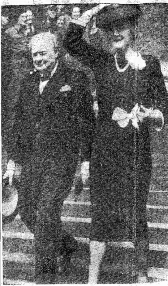
Vinstonas Čiorčilis su žmona prie St. Paul's katedros, kur buvo minima pergalė Europoj. Liepos 5 dieną bus rinkimai Britanijoje, kurie nupriešt St. Paul's katedros, kur buvo minima pergalė Europoj. Liepos 5 dieną bus rinkimai Britanijoje, kurie nupriešt St. Paul's katedros, kur buvo minima pergalė Europoj.

Nors dar per anksti kalbėti, bet po liepos 5 dienos