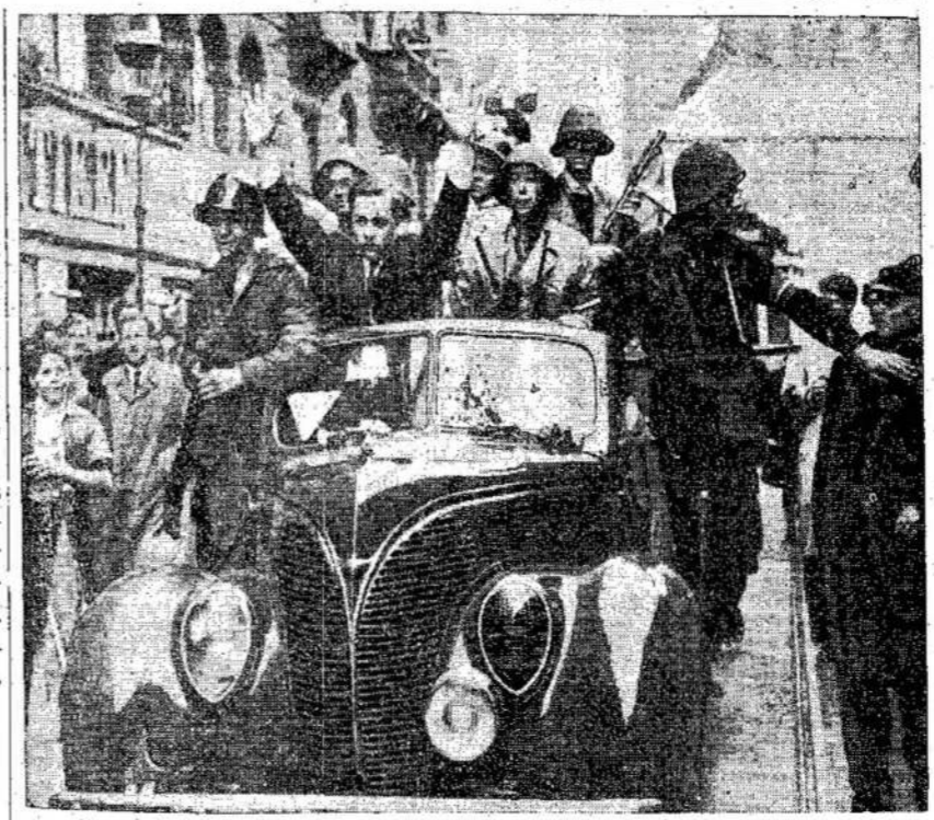
Visuos išlaisvintuos kraštus dabar eina medžiojimas ne tik besilapstančių vokiečių, o ir savų išdavikų. Ciamatote danus patrijotus, sugavusius išdaviką, nacių bendradarbi. Bus daug darbo iki visi kraštai išsiuos iš savo tarpo naciškas šiukšles, sutėrusias tautų vardą ir patrijotizmą. Panašių išdavikų buvo ir Lietuvoje.

MASKVA. — Krasnaja Zvezda komentatorius čionai skelbia, kad lenkų generolai — Anders, Sosnkowski ir Komorowski (Bor) — lavinami 300,000 armijos, kuri briausis Lenkijon. Ta armija planuoja briautis į Lenkiją iš šiaurės Vokietijos bazių, kurias dabar valdo Britanijos armija. Tasai sukalbis, sako šis komentatorius, yra nevien prieš Lenkiją, bet ir prieš Sovietų Sąjungą ir abelnai Europą, nes tai reiktų naują karą. Karo pamokos nepamokino tų lenkų politikierių ir generolų, sako Sovietų komentatorius. "Jie negali priptapti prie naujų sąlygų. Jie planuoja naują karą." Tas komentatorius sako, kad britai leidė lenkų generolams ten veikti visai kitu tikslu, būtent, pagelbėti Aliantams okupavime Vokietijos, bet įsigavę ten ponai generolai skymuoja prieš taiką.