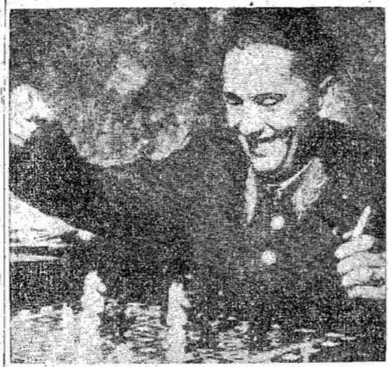
Jugoslavų vadovs maršalas Tito matomas prie sąjungininkų ir Jugoslavijos kilo ginčai, kuomet sąjungininkų jėgos užsime išvartė jugoslavus iš tų vietų, kurias išlaisvino jugoslavai.