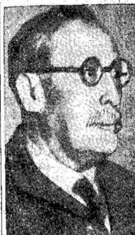
Leonas Blumas, Francijos socialistų vadas, kurį vokiečiai laikė koncentracijos kempėse iki sąjungininkai išlaisvino. Buvo pasklidę gandai, kad jis buvo nužudytas, bet pasirodė, kad ne.