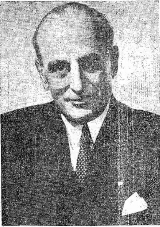
Joseph E. Davis, buvęs Amerikos ambasadorius Meksikoje, vyksta į Berlyną su prezidentu Trumanu.

Demokratinis kelias yra vienintelis kelias, kuris gali garantuoti ne tik ramybę ir pakenciamą gyvenimą, bet ir prailginti šios sistemos gyvenimą. Griebimasis šnipijados, juodrankystės prieš Sovietų Sąjungą ir aplamai pažanga, veda prie to, prie ko atvedė Vokietiją hitlerininkai.