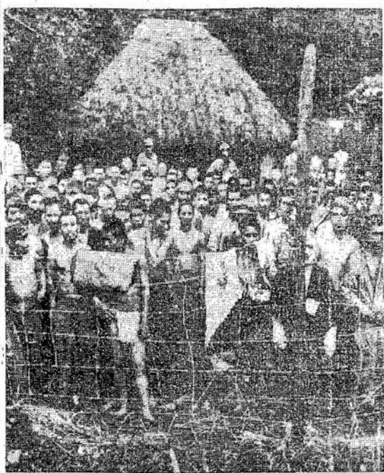
Japonai belaisviai, suimti Okinawoj. Iš arti 100,000 japonų ant Okinawos tikrai ke-

Rusams nėsą uždrausta kalbėtis su vokiečiais ir abiejų draugystė esanti labai graži.