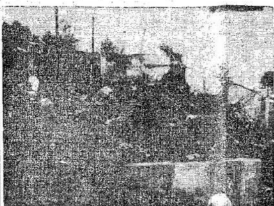
Čia matote liekanas trijų aukštų viešbučio Red Lake. Ont. Kadangi viešbutis buvo medinis, tai jis užsilieps-

Teismo Darbuotojų Kursai Nuo kovo 1 d. Vilniuje Teisingumo Liaudies Komisaraiats organizuoja teismo bei prokuratūros darbuotojų kursus paruošti kursams. Kursų trukmė 6 mėnesius, priimami vyrai ir moterys nuo 23 iki 40 metų amžiaus, baigę vidurines mokyklos kursus. Pažymėtina, kad 3 mėnesių kursai jau buvo suruoš-