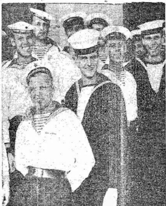
Brothers in arms, the Soviet and Canadian sailors have a lot in common and while they don't speak the same tongue, they understand the language of heroism — and the language of fun when there's time out from the grim realities of war. They had lots of fun when they paid a visit to Sunnyside in Toronto.