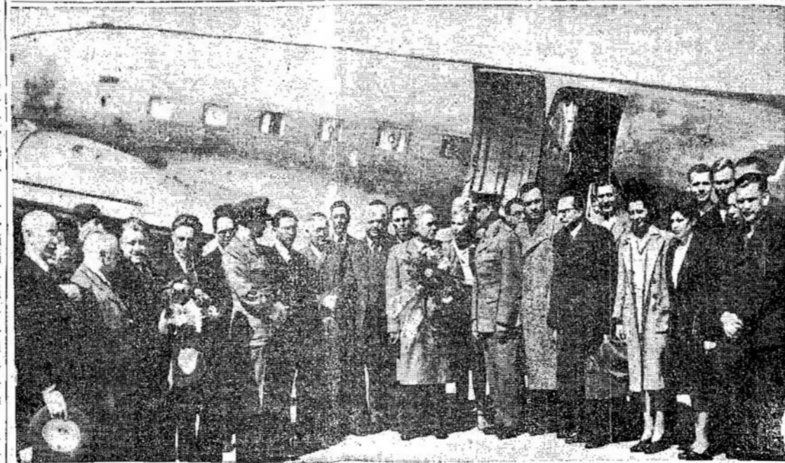
Sovietų Sąjungos delegatai, laivio Edmontone, iš kur jie išskrido atgal į Sovietų Sąjungą. Kanada yra svarbus punktas tarp Jungtinių Valstijų ir Sovietų Sąjungos. Štai kodėl Kanada stengiasi būti geruos santykiuos su SSRS. Kas griauna tuos santykius, tas kenkia Kanadai.