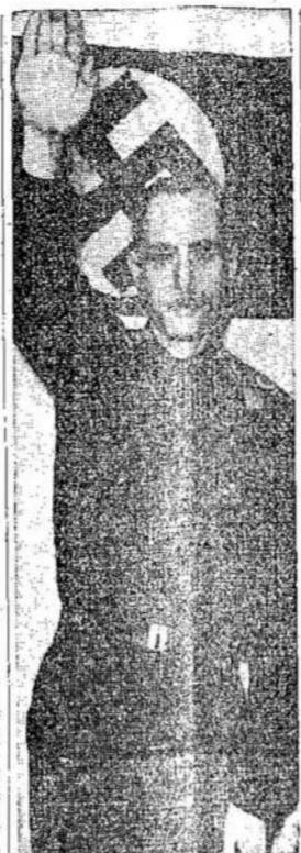
Andrien Arcand, Kanados fašistų vadas, kuris paleistas iš koncentracijos kempės. Darbo žmonės protestuoja ir reikalauja, kad jis būtų teisiamas kaip Hitlerio bernas Kanadoje. Šis paveikslas trauktas pirmo kuro.

Pagal tokią platų visų užgyrimą, o taipogi užgyrimą ir Sovietų Ambasados, mūsų Komitetas priėjo nuomonės, kad reikia vesti vajų už dar daugiau tokių instrumentų pasiuntimą mūsų broliams ir sesėms Lietuvon. Lietuva naciai visapusiškai nuterionta, viską sugriovė ir tokie medikaliai instrumentai, Komitetui atrodo, yra geriausia dovana. Tačiau, vajui baigiantis, jei bus platus patarimas ir patarimas iš vyresniųjų komitetų, Komitetas galės tą nutarimą pakeisti ir vietoj medikalių instrumentų, pasiūsti ką kitą, kas labiau Lietuvos žmonėms bus reikalinga, jeigu jiems bus kokie kiti dalykai labiau reikalingi arba sunkiau gaminami, negu medikaliai instrumentai. Tačiau, kaip šandie dalykai stovi, tai didžiausias