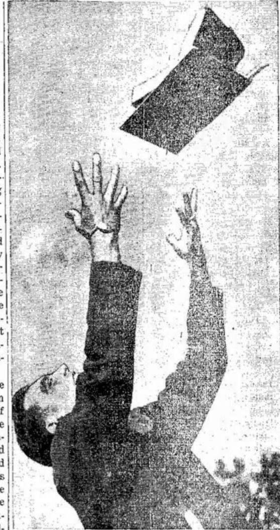
No more Latin for this Saskatchewan high school student and he throws away his Caesar because under the Saskatchewan government's curriculum he'll take what he needs only. No more

The Germans were hurled from Siauliai. In the short lull that followed the newcomers were trained and the Lithuanian Division now, cooperating with the army of guards, helped to breach enemy's front on Dubisa river south of Siauliai. The Lithuanians pledged that they would be worthy neighbours of the guards and proved as good as their word. The successful outcome of the operations was determined in the first hours of the fighting. Covering some 150 kilometers, the Lithuanian Division straddled the Klaipeda-Tilsit highway. Clinging desperately to Lithuania and free their