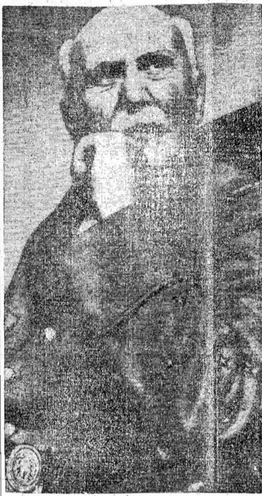
Maršalas Petėnas nusiminęs klausosi liudininkų parodymų, kaip jis dirbo prieš sąjungininkus, kooperavo su hitlerininkais ir suokabiuavo prieš Francijos demokratiją.