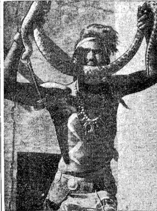
Prescotte, Arizonos valstijoje, yra religinė sekta, kuri kas met rengia šokus su gyvatėmis. Prisirenką gyvačių ir paleidę jas į šalę tos sektos pasekėjai šoka. Gyvačių būna tiek daug, kad jos vinyojasi šokiams ant kaklų. Vieno vietoj policija surado ir nuodingų gyvačių.

Šis karas daugeliu žmonių sunkiai suprantamas. Per šį karą įvyko daug naujo. O laiko diskusijoms buvo mažiausia. Tad nėra dyvo, kad įvyko vienokių ar kitokių klaidų.