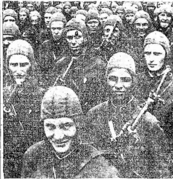
Būrys raudonarmiečių iš Sibiro armijų, kurios smogė japonams Mandžurijoj. Japonai greitai pamatė, kad jiems nėra prasmės tęsti kovą ilgiau. Jie žinojo, kas atsitiko naciams raudonarmiečiams perėjus į ofensyvą.