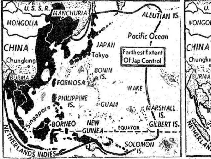
Šie žemlapiai parodo kiek japonai užgrobė ir kiek jie palikta. Kairysis žem-lapis parodo, kiek japonai užgrobė ir kiek jie palikta. Kairysis žem-lapis parodo, kiek japonai užgrobė ir kiek jie palikta.

sur ramu. Krautuvės ir net restoranai buvo uždaryti. Bet tik tam tikram laikui.