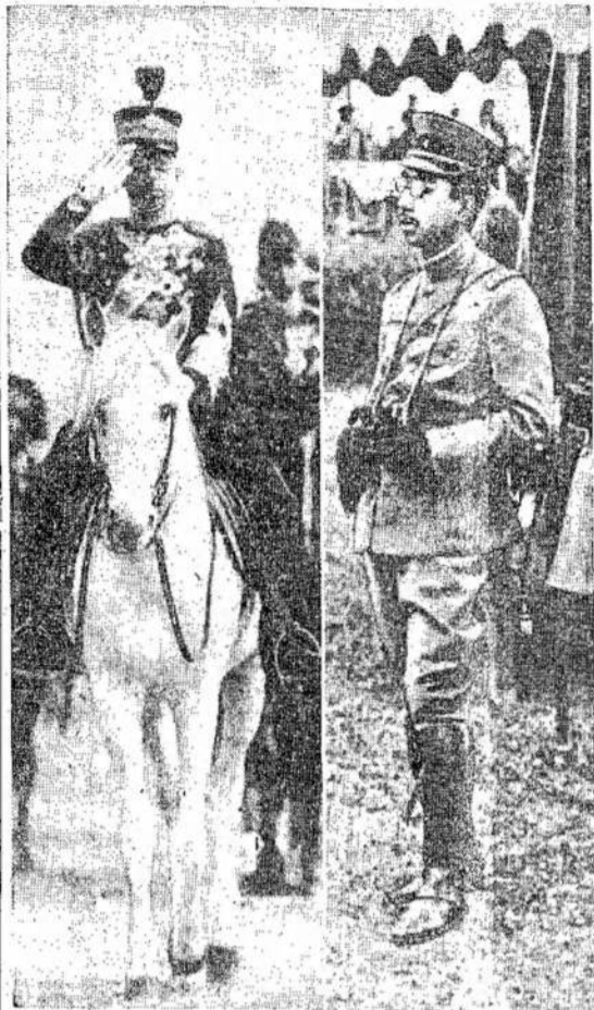
Japonijos imperatorius Hirohito. Sakoma, kad japonai laiko jį dievu.