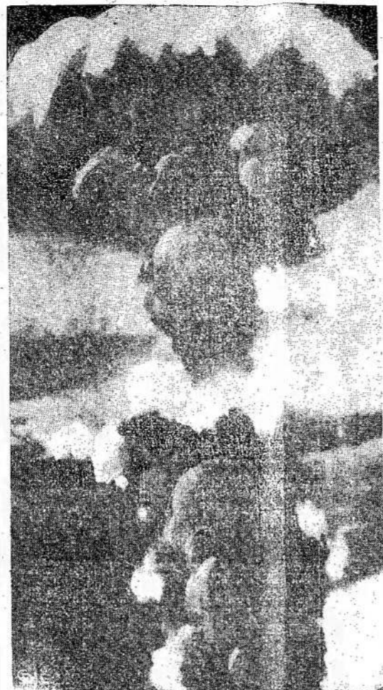
Dūmai kyla j padanges virš Nagasakio miesto po atominių bombos sproginco. Sako ši — antroji — buvo daug smarkesnė, negu pirmoji, numesta ant Hirošima.

"Socialistai ir komunistai turi vieną bendrą principą — tai yra, kad visi darbininkai vienytysi." "Didysis socialistų siekis," tęsė toliau Blumas, "yra, kad žmonių gyvenimo sąlygos būtų pakeistos. Žmogus turi būti išgelbėtas iš išnaudojimo ir vergavimo."