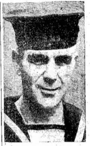
Internacionalo žodžiai, "Kas buvo nieks, tas bus viskuo," tam tikram laipsnyje pildosi ir Britanijoje...

Taip tai užsibaigė paminėjimas karo užbaigą ir su so-