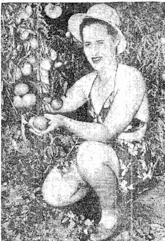
Kelios iš armijos pasiūlosavusios merginos nusipirko šėsių akryl farmą Beamsvilėj Ont., sudėjusios kartu

"Nors teisingai kėlėm į viršų ir kovojom su CCF vadų deitizmu, kurie pranašavo apie neišvengiamą ir automatišką ekonominį sumukimą ir chaosą su karo pabaiga, vistiek mes neapsisaugojom nuo revizionistinių idėjų vystymosi tuo klausimu. Taipgi kada mes pabrėžėmė, ką būtų galima padaryti, jeigu darbininkų ir demokratinės jėgos būtų stiprios ir vieningos, mums reikėjo savo propagandoj nurodyti ir į pamatinius kapitalistinės ekonomijos krizių pasikartojimo įstatymus, o mes nenurodėm. To pasekoj, buvo užleista dirva visai klaidingai idėjai, kad galima