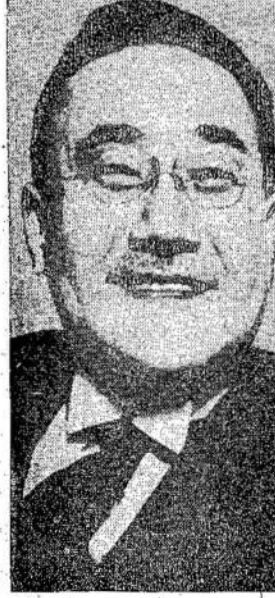
Baronas Kijuro Sidehara, naujas Japonijos premjeras.

Įdomiausių dalyku buvo požeminio traukinio planas ant sienos. Apačioj mygtuku