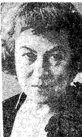
Mrs. Alexandra Michailovna Kolontaj, pirmą Sovietų moteris ambasadorė. Ji ambasadorės pareigas ėjo Šveicarijoje. Dėl sveikatos pakrypimo ji iš tų pareigų pasitraukė.

Rengėjai, ruošda m i e s i šiam paminėjimui, buvo tikri gauti kalbėtoją iš Jungtinių Amerikos Valstijų, kaippo vieną iš žymiausių visuome-