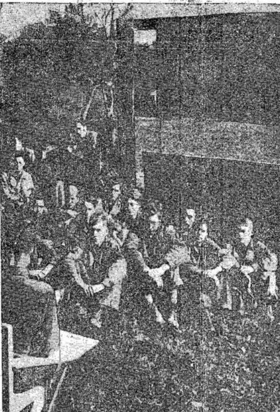
Jauni vokiečiai belaisviai mokinami įtikėjimo, kalbų, mokinami demokratijos meno ir komercijos. Kempėj laisvų kempėj Francijoje, Jie randasi 17,000.

Ims daug laiko iki Europa užgydys visas hitlerizmo ir karo žaizdas. Jos yra baisiai didelės. Sunku viską apimti žmogaus protu. Ypatinai sunku tą viską apirpti šio