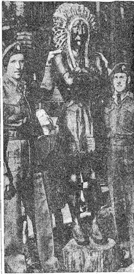
Si indijonų viršininko statula išbuvo užjūryje penkis metus su Hastings and Prince Edward pulku. Tai pulko "Iaimikis". Dabar jis pargabenamas atgal į Belleville, Ont., iš kur buvo paimtas.

Visiems už aukas ir pasidarbavimą, širdingai acių. Administracija