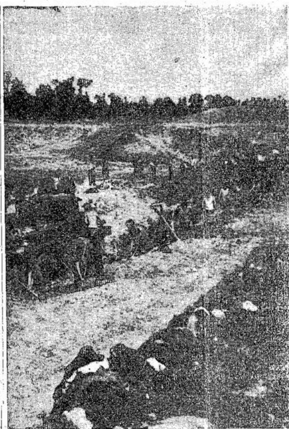
Vokiečiai belaisviai mokina-venimą patiems. Kas padami ne tik demkratijos, bet ryta kitų darbu, priklausos ir sunkaus darbo. Jie turi kitiems, o ne vokiečiams, samokėti, kaip pasidaryti gy-ko mokytojai.

LIAUDIŲ BALSAS Yra Visų Lietuvių Draugas