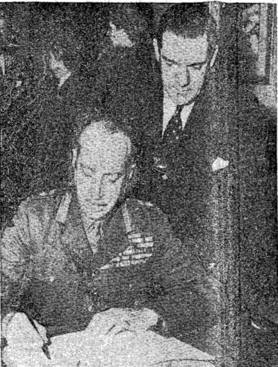
Generolas Crerar, kanadiečių komandierius užjūryje, rašosi į svečių knygą Torontе, miesto majorui žiūrint. Torontas paskelbė pusę dienos švente, kada jis atsilankė į Torontą pereitą savaitę trečiadienį. Jo komandoj kanadiečiai atliko didelius žygius Europoj.