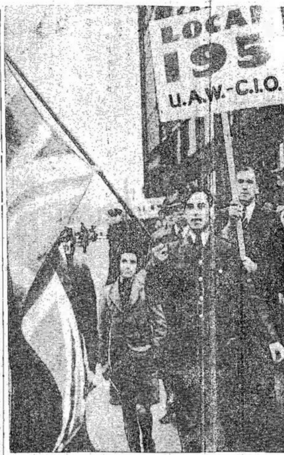
An airman carrying a flag leads a picket line in Windsor. About 100 wore army uniforms in the picket lines. They are said to be discharged men.

In Spain thousands are in concentration camps and terror is living in prisons. Hungary's economic stability is due to Soviet assistance. Machinery and animals that were used by the Germans are now being used by the people, but food is still scarce. The World Youth Conference pressed the Government politicians to rush aid and assistance to starving Europe's peoples.