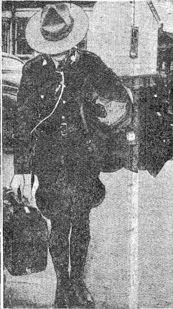
Federalės valdžios prezentas Provincialė valdžia keletą šimtų streikerių. Desėtkų tūkių "taikos" darytoj valdžia pasuntė į Windsorą.

Kai kas nori perstatyti, kad būtų nedemokratiška, jeigu kompanija turėtų išrinkti duokles ir iš jų, kurie nenori prigulėti prie unijos. Gerai, bet kas gi demokratiška? De-