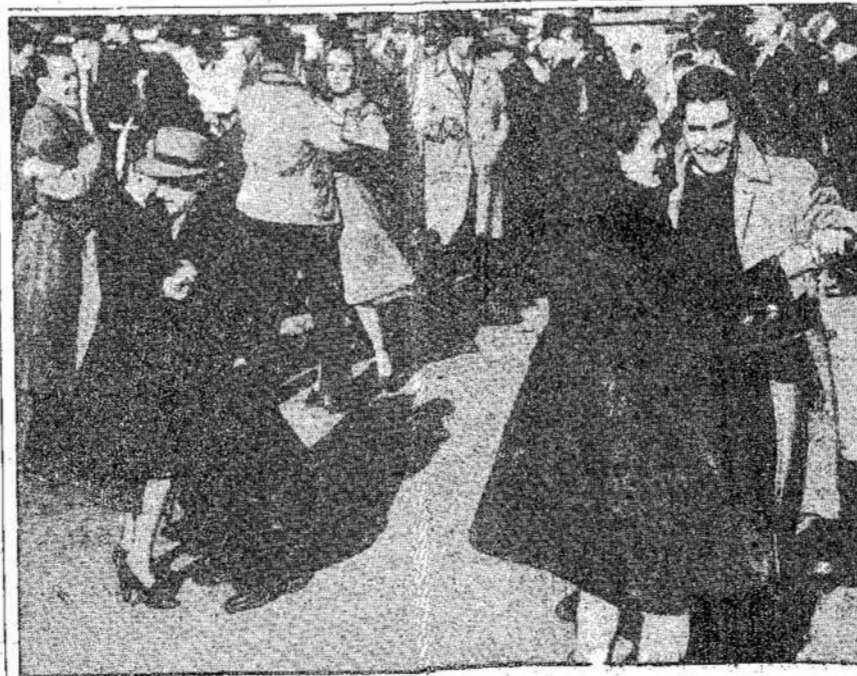
Street dancing helps to pass the hours for the picketer and here strikers at the Ford plant swing their partners before the main gate to the music of their own band while their leaders confer with government and company representatives.

Just a little reminder! For laughs, dancing and an evening of enjoyable entertainment don't miss the "Hellzapoppin Social" Friday, Nov. 16. Advertise the affair and bring all your friends.