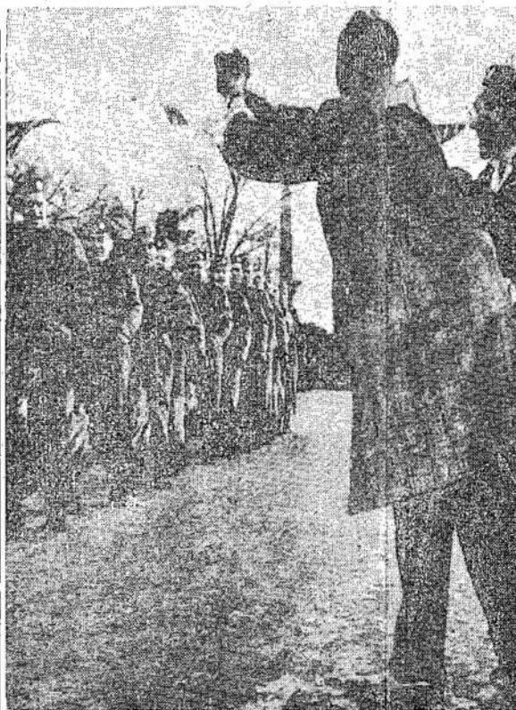
Cheering thousands lined the parade route in Toronto as the Queen's Own Rifles marched to dismissal. Two

trains brought 42 officers and 667 other ranks home from Halifax. More and more of the boys are coming home.