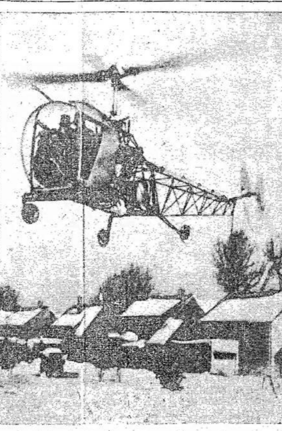
Nežiūrint to, kad Buffalo mieste prisnigo 70 colių aukščio sniego, ne visiems reikėjo kastis. Čia matomi du piliečiai turėjo savo kime helikopterį, kuris iškilo iš sniego, kaip iš kokių pūky.

LONDON. — Jungtinių Tautų Organizacijos prirengiamoji komisija nutarė, kad Jungtinių Tautų Organizacijos buveinė būtų kur nors rytinėse valstijose, Amerikoje.