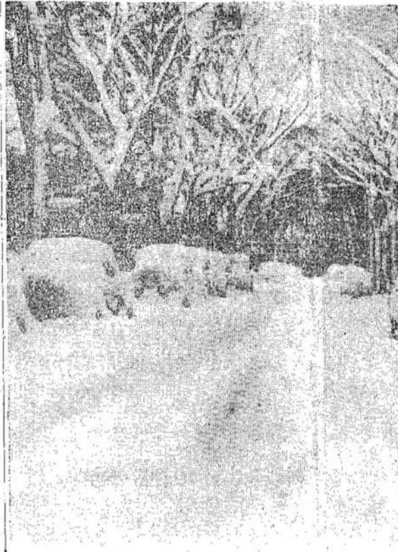
Štai kaip Buffalo miestas Buffalo miestas šiemet gaisrodė po sniego šturmo. Apsuodė po sniego šturmo. Tuo tarpu Toronto miestas Toronto miestas veikia neturi sniego, o Toronto miestas Toronto miestas veikia neturi sniego.

Hamiltono augimas iš pradžių buvo lėtas. 1836 metais jis turėjo vos 2,846 gyventojus. 1846 metais turėjo 6,832 gyventojus. Iki 1867 metų jis nedaug paaugo. Tik tai laike civilio karo Jungtinėse Valstijose Hamiltonas