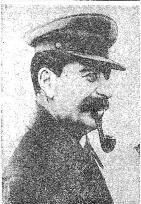
Sovietų Sąjungos premjeras Stalinas, kuris šiomis dienomis sugrįžo į Maskvą po ilgų atostogų. Gruodžio 21

CUNKING. — Komunistų pasiūlymas daryti paliaubas atrodo neranda rimto pritarimo pas Čiangkaišeką ir jo sėbrus.