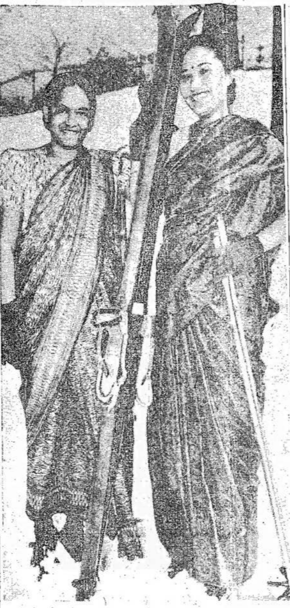
Spėkit, kuo šios indietės studentės Toronte taip patenkintos. Tikėsit, ar ne, bet jos patenkintos sniegu. Indijoj būdamos jos niekad nematė, į ką sniegas panašus. Dabar jos gali net čiuipinėti jį ir čiuožti ant sniego.

Per 1944 metų Kalėdas užjūryje buvo 450,000 kandaiečių.