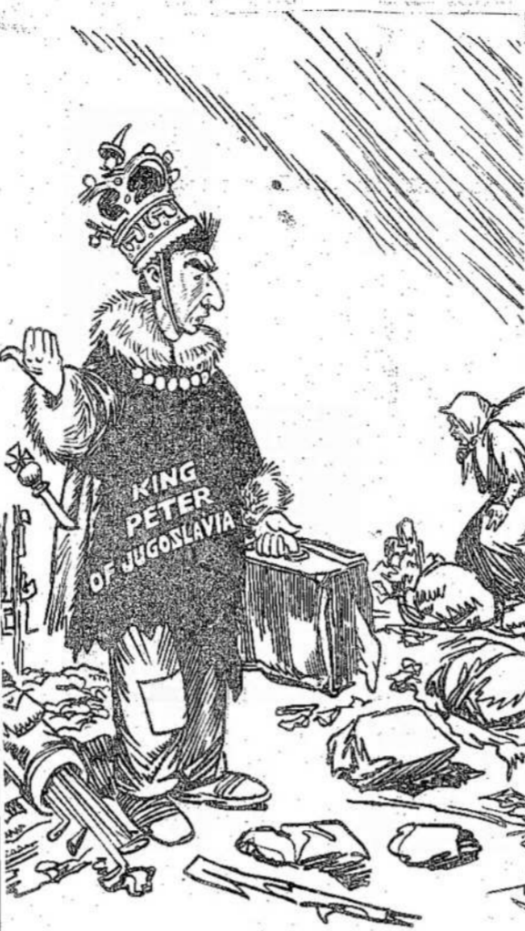
Dar Vienas Išvietintas Asmuo

Cia galima pastebėti, kad Kanados lietuviai savo kovotojų niekad nepamiršo. Tik per Liaudies Balsą jie yra pasiuntę tiems kovotojams dovanų už 900 dolerių su viršum. Kurie dar užjūryje, tiems ir toliau yra siunčiama cigarečių ir kitokių dalykų.