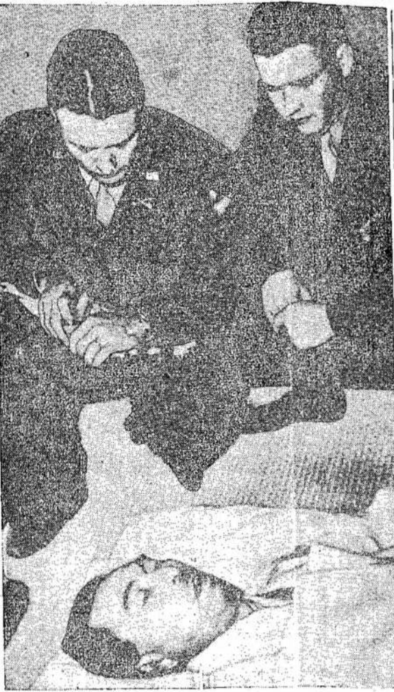
Amerikiečiai sėdi prie kriminalistų teismą. Jis bu-galkšėjo Konoje, kuris nusi-vo du kartu japonų premje-žudė, kad nepatekti į kariškų ru.