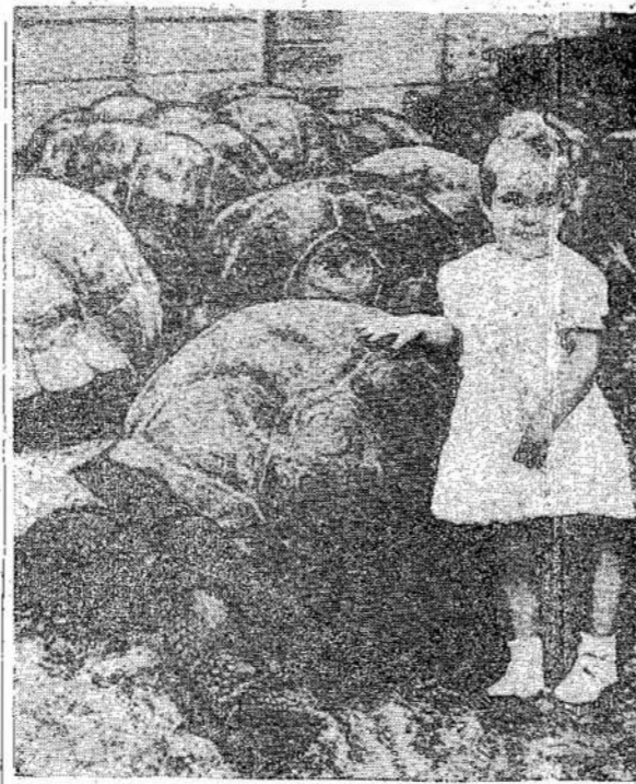
Cia matomi želviai (tortoise) no gyventojai. Prie jų stovi sverta po 500 svarų ir yra North Miami zoologijos sodnesių mergaitė, 16 mėnesių mergaitė.

Būitai atidavę japonams Singapora be didelio pasipriešinimo.