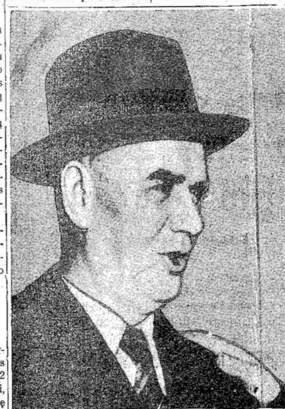
Philip Murray, CIO prezidentas, ir Henry J. Kaiser, industrialistas. Kaiserio automobilių kompanija Detroito Trumano rekomenduo-

Generolams reikėjo hitlerinų partijos kaip priemonės dėl ideologinės mobilizacijos žmonių tokiam karui. Trynimasis, kuris buvo tarp nekurių generalų ir Hitlerio, ir kuris buvo paremtas ant kovos ūz galią, negali ūdengti vyriausio faktoriaus, kad tarp hitlerinų ir generalio štabo buvo bendras supratimas.