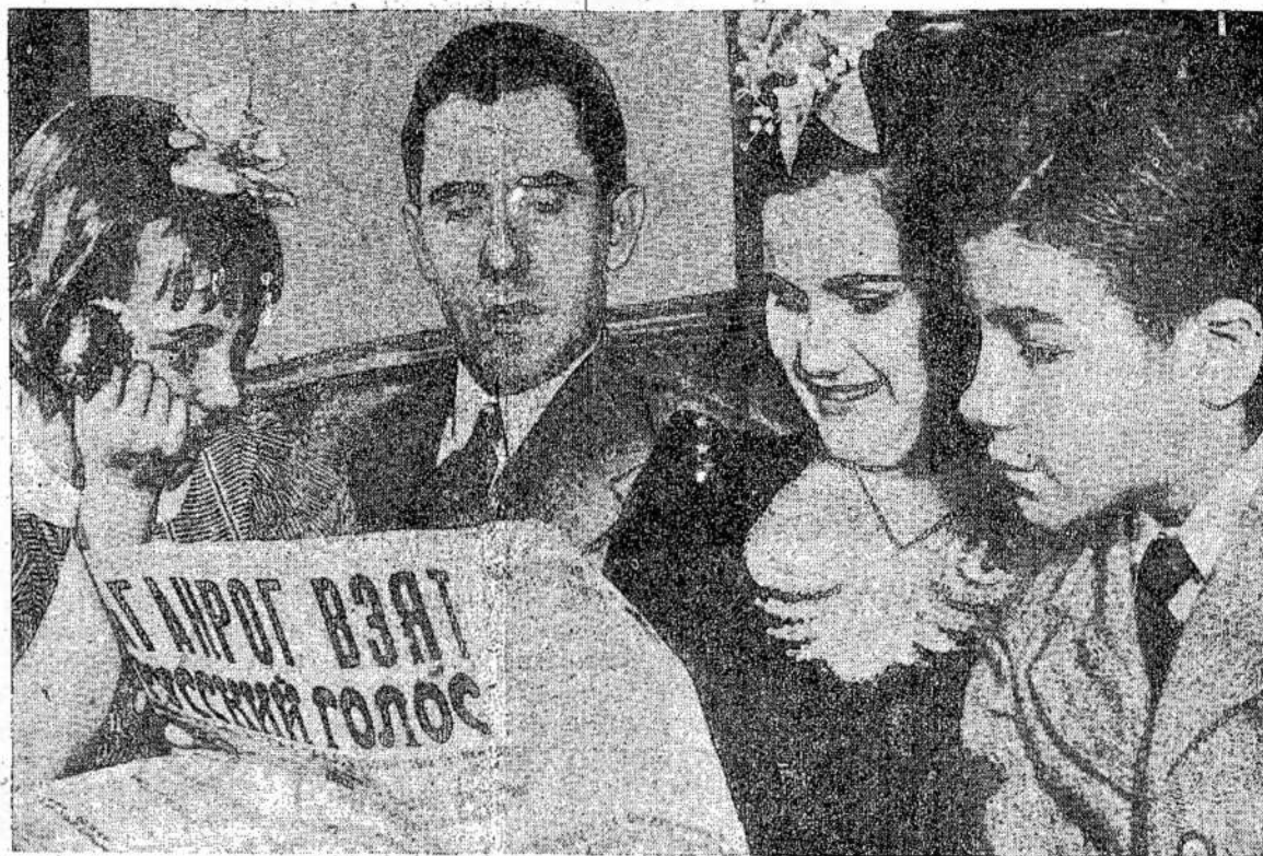
Andrej A. Gromyko, Sovietų Sąjungos jaunas diplomatas ir Jungtinių Tautų Saugumo

CUNKING. — Dem. Lyga sako Čiagkaiškas yra nužudęs nekuriuos politinius kalinius.