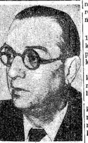
Felix Gouin, laikinasis Francijos prezidentas. Jis išrinktas po to, kai generolas De Gaulle rezignavo. Iki šiol jis ejo seimo prezidento pareigas. Pagal politines pažiūras, jis yra socialistas.