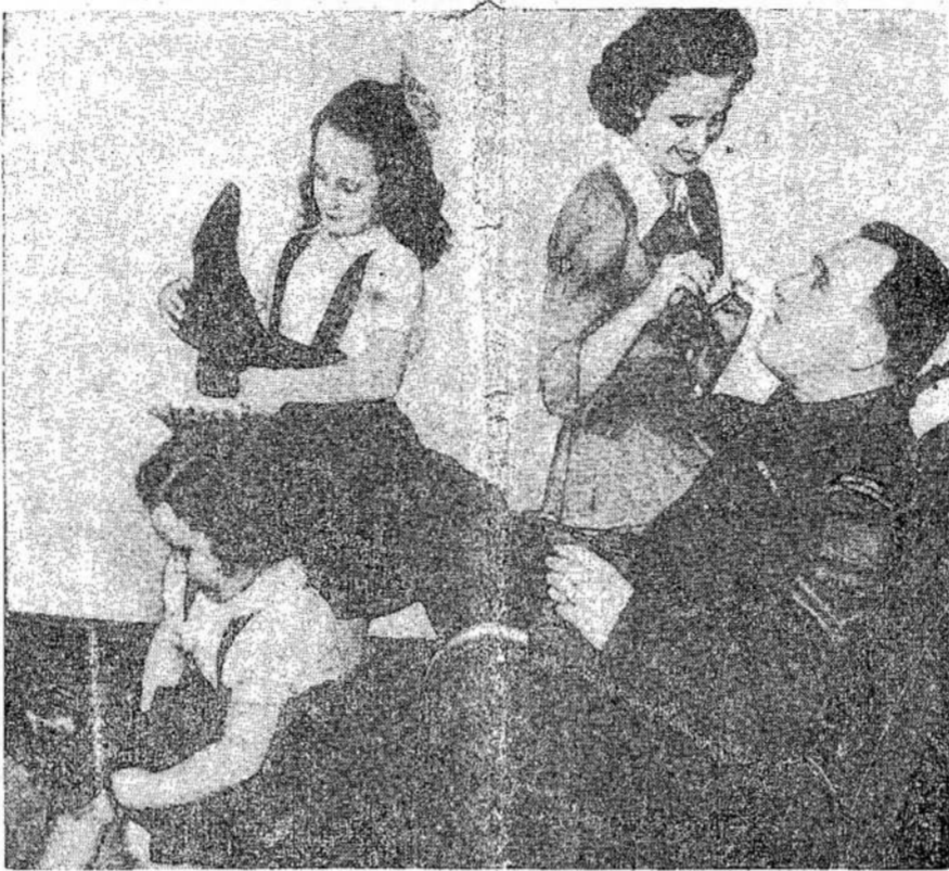
Kaip puiku būti vėl namie, savo šeimyną, su kuria jis nesimatė per kelis metus. Čia jis matomas dukterimis ir žmonai aptarnaujant jį. Bet jis užsitarnavo tokią meilę apgindamas Kanados laisvę

Vokiečių tarnai dažnai nudojo, generolus ir kitus aukštus pareigūnus.