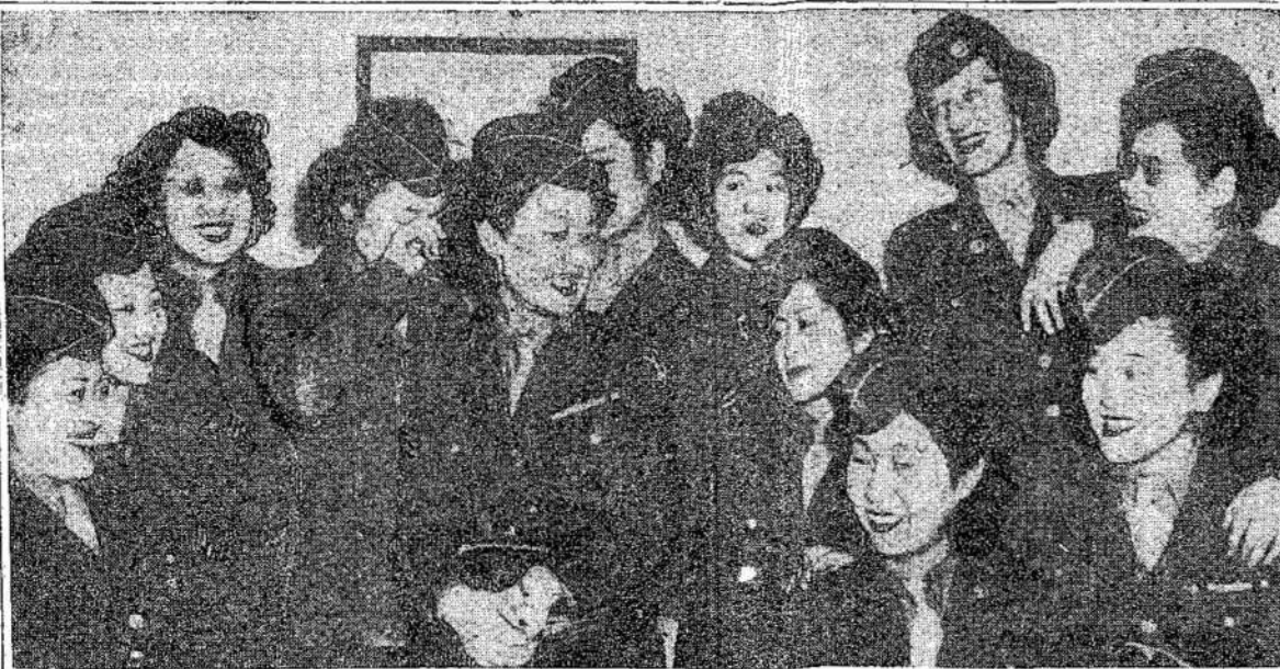
To assist Gen. Douglas MacArthur, these 11 Japanese girls and one Scandinavian are being flown to Japan

Friday, February 15th, the Polish Club are holding a Valentine Social, corner Dundas and Ossington. A swell time is guaranteed for all.