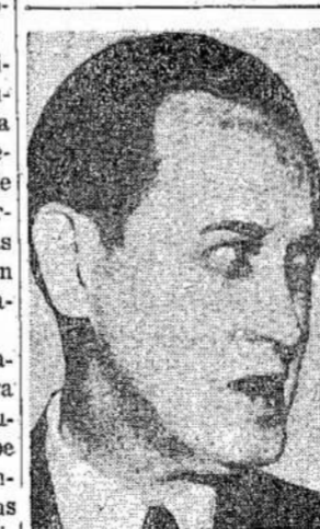
Harry Hopkins, buvęs velionio prezidento Rooseveltto artimas draugas ir geras talkininkas, mirė pereitą savaitę, sulaukęs 56 metų amžiaus.

Plieno industrijoj Kanadoj (Hamilton, Sault Ste. Marie ir Sydney, N. S.) dirba 13,000.