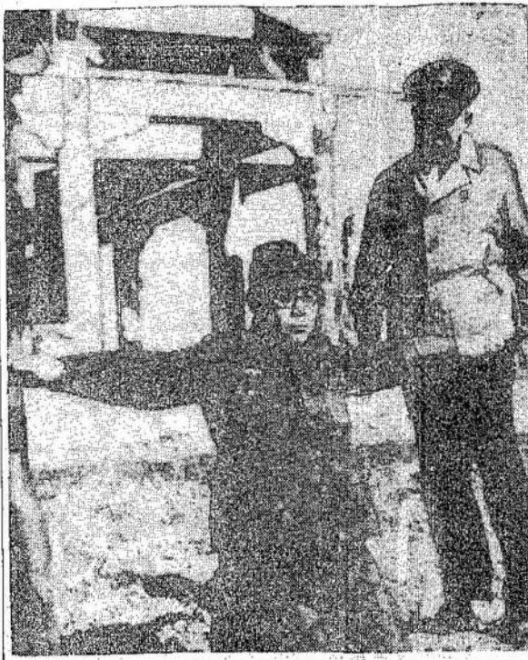
Šis japonas rodo, kaip trys amerikiečiai laktūnai, kurie buvo priversti nusileisti Japonijoj po bombardavimo Tokijo miesto pirmu kartu, buvo sušaudyti pririšus juos prie kryžių. Už tai atsakomyngas karininkas nuteistas.

Žmonės turėtų daugiau veikti dėl taikos. Kada ją steigs vien tikrai guzikuoti diplomatai, tai ji nebus broliška ar pastovi. Toks svarbus reikalas turėtų atkreipti didesnę atydą visų žmonių.