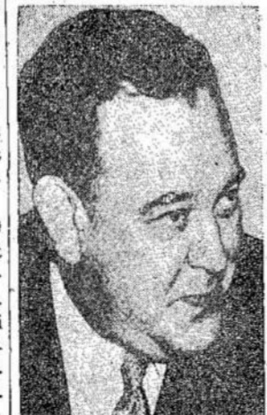
Trygvie Lie, Norvegijos užsienio reikalų ministeris, kuris pereitą savaitę buvo išrinktas Jungtinių Tautų organizacijos generaliu sekretorium.

Konferencija pasisakė už didesnę Vokietijos apvalymą nuo naciškų kriminalistų ir apvienijimą Vokietijos į vieną ekonominę vienetą.