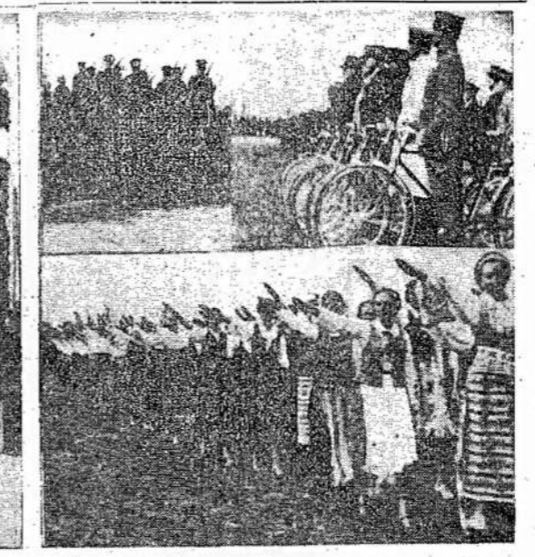
Scenos iš šunlių parado prieš liutuojant naciškai, rankas ištiesus. Viršuj matyti šaulės šaulės čia matomos šauliai raiteliai ir divratininkai.