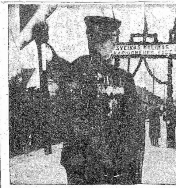
Generolas Raštikis, prieš Smetonos valdžios buvęs kariuomenės vadas, įteikia vėliavą šauliams. Šauliai prieš Smetonos buvo Lietuvos kariuomenės vadas, įteikia vėsmogikali.

Jungtinių Tautų organizacija užbaigė savo posėdžius ir dabar susirinks tiktai rudenį. Laikina buveine bus New York, kur ji ir susirinks sekantiems posėdžiams.