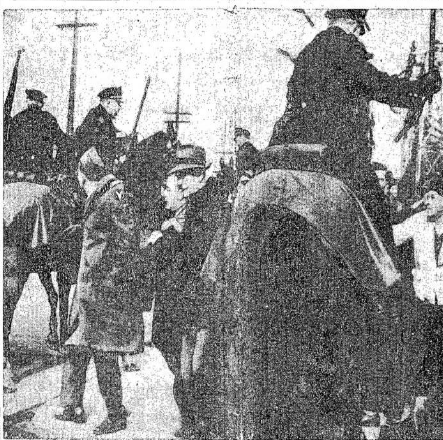
Tai ne "raudonasis teroras" kada jiems nebegrūmoja išlaidinis priešas. Pamiro jie kur nors Europoje, o Filadelfijos policijos kazokai daužo galvas pagalais pikietininkams, kurių tapę daugelis tik užsibaigusio karo veteranų. Tokia tai pagarbą kapitalistai rodo darbininkams, kojų visas skelbtas laisves.

Kongresas taipgi užgyrė jūrininkų unijos reikalavimus, kad ant didžiųjų ežerų laivų nebūtų dirbama ilgiau, kaip 8 valandos, mokant senas algas.