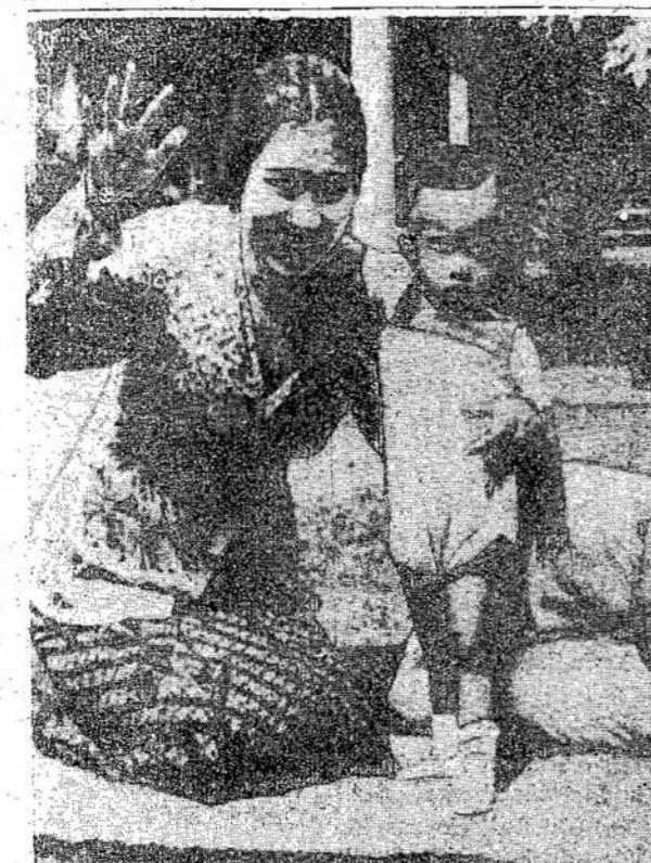
Dr. I. R. Soekarno, Indonezijos nepripažintos respublikos prezidentas, su savo šeima. Indonezai nori nepriklausomą režimą. Olandija nenori duoti nepriklausomybės Indonezijai.

Be to, biblioteka turi jau visoje Lietuvos Respublikoje 42 abonementinius centrus, kuriems iš savo fondo skiria knygas. Abonementiniai centrai yra prie visų apskrities miestų sveikatos skyrių, mokslo tyrimo institutų, med. fakulteto klinikų, med. vidurinių mokyklų bei kitų med. įstaigų.