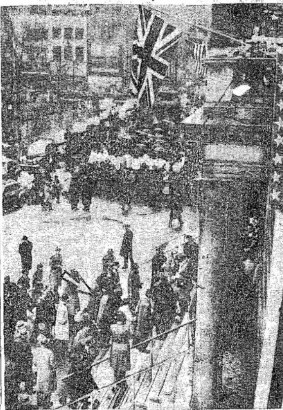
New Yorko darbininkai demostruoja prieš Ciorėlį, ga. Darbininkai toj jo kalboj kuris agitavo už britų ir amerikiečių militarinę sąjungą.

Bimbos prakalbos bus didelis smūgis melagiams, kurie kepa visokius melus namie ir rankiojasi iš pabėgėlių, Hitlerininkų draugų.