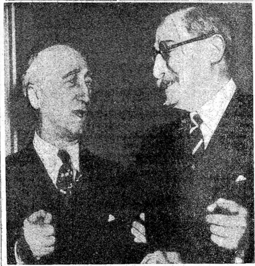
Jungtinių Valstijų valstybės sekretorius Byrnes ir Fran-SSRS, jeigu Amerika neduos cijos atstovas Blumas. Fran- cijos atstovas Blumas. Fran- cijos atstovas Blumas. Fran- cijos atstovas Blumas.