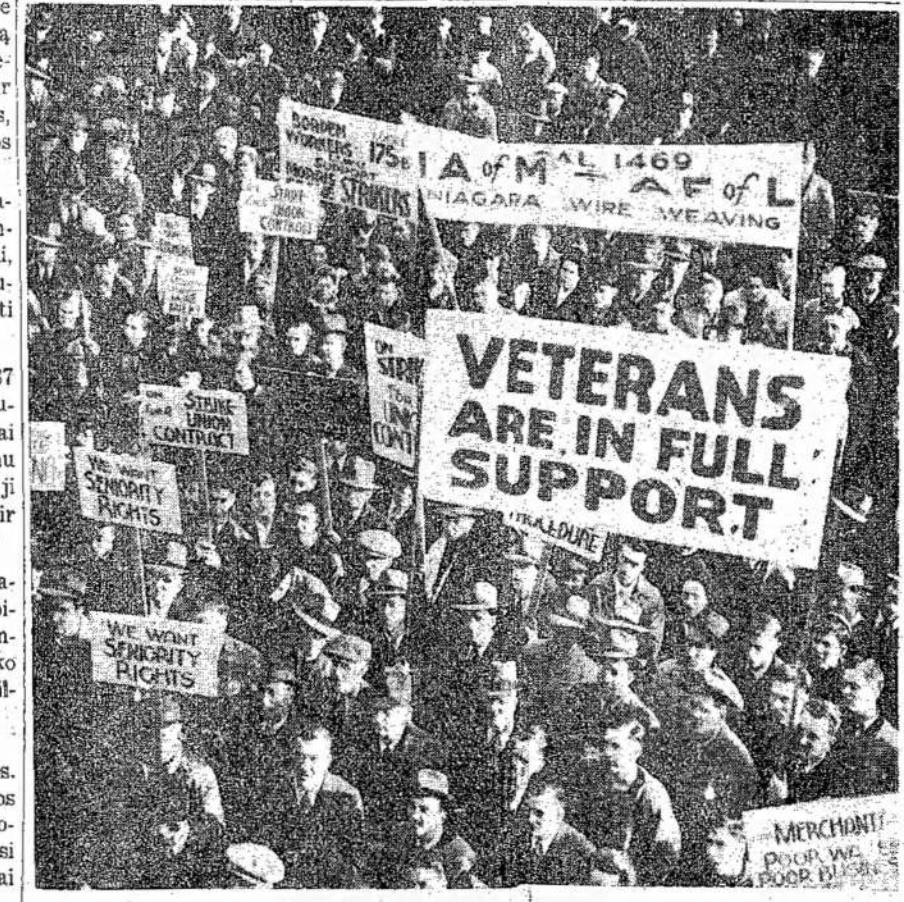
Niagara Falls darbininkai, Hoist kompanijos darbininkams, išėjusiems į streiką. Veteranai sako, kad jie su