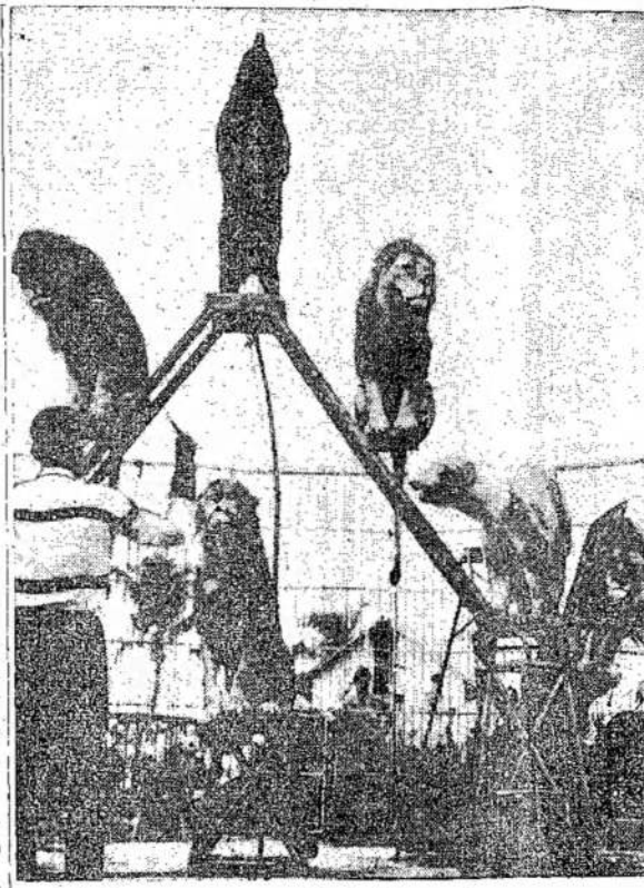
Sakoma, kad tik tai žmogus, kuris turi protą, nors ne tiek, kad priešingai yra. Jeigu išvystytą, kiek žmogaus prožvėrys gali suprasti, ką žmōtas.

Jo manymu, Kanada turi atkreipti didelę atydą į šį klausimą.