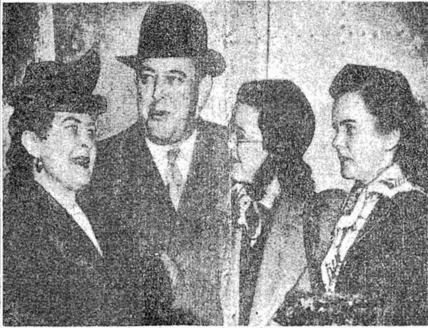
Trygve Lie, Jungtinių Tautų Organizacijos generalis sekretorius, su savo šeima. Jis atvyko į Jungtines Valstijas, nes čia dabar vyksta JTO konferencija.

Prezidentas Trumanas paskelbė, kad atominių bombų išbandymas ant laivų, yra atidėtas.