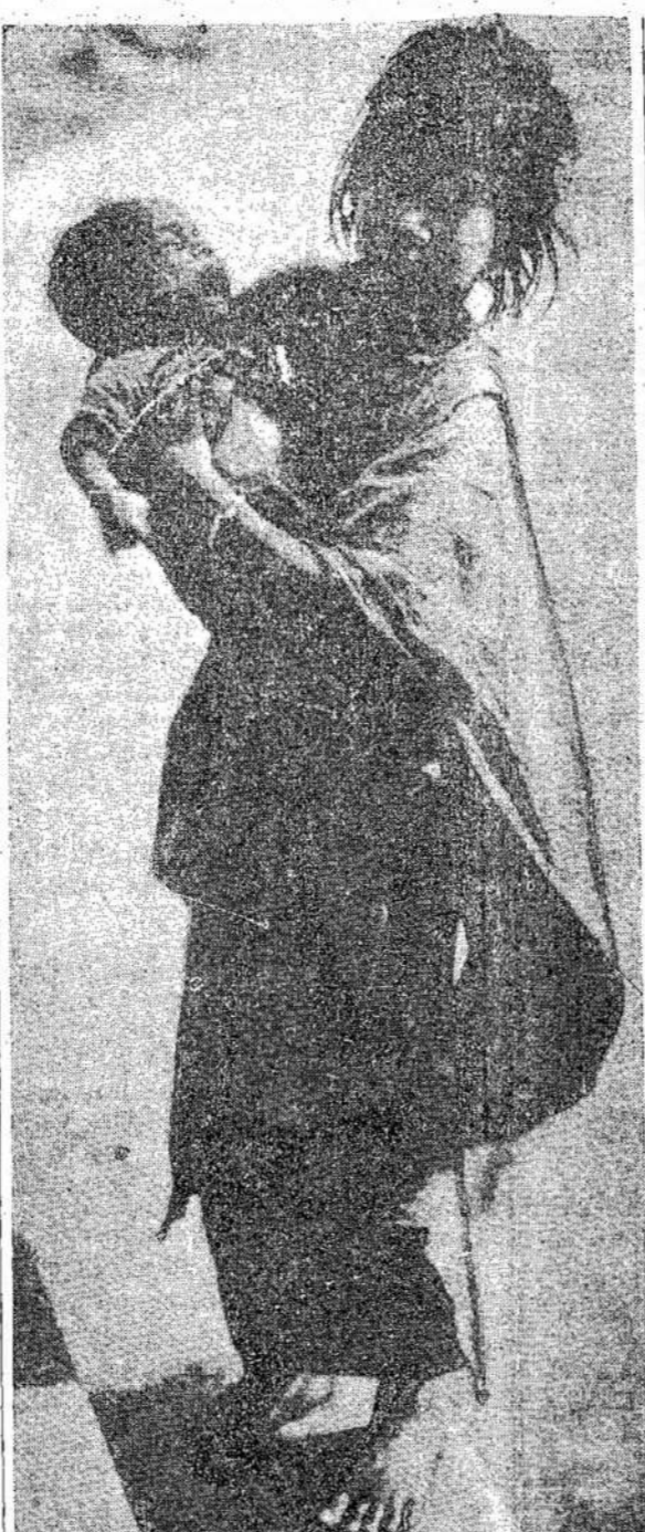
Milijonams Indijos žmonių grumoją badas. Karas su mažino ryžių bamyba, o ryžiai buvo pamatinis milijonų maistas. Čia matote mergaitę su kūdykiu rankose. 60,000,000 Indijoj taip vadina neličiamųjų kenčia baisy skurdą. Indų už tai kaltina britus.

Korelo-Suomijos žmonės yra nusistatę atsteigti kuo trumpiausiu laiku viską, ką tik prieš sunaikino. Tas bus padaryta, žinoma, su pagalba broliškių sovietinių respublikų. Korelo-Suomių respublikai reikia traktorių dėl agrikultūros, įrankių dėl naujų industrinių imonių, medžiagos ir techniškių rankų miestus.