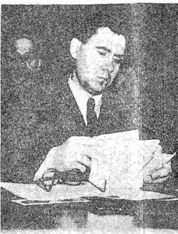
Andrei Gromyko, jaunas Sovietų diplomatas ir ambasadorius Jungtinėms Valstijoms. Jis taipgi atstovauja SSRS Saugumo Taryboje, is

TOKYO. — MacArthur jau senai įsakė Japonijos trustus — Mitsubisha Mitsui ir kitas monopolines kompanijas išardyti, bet jos ir pošiai dienai gyvuoja.