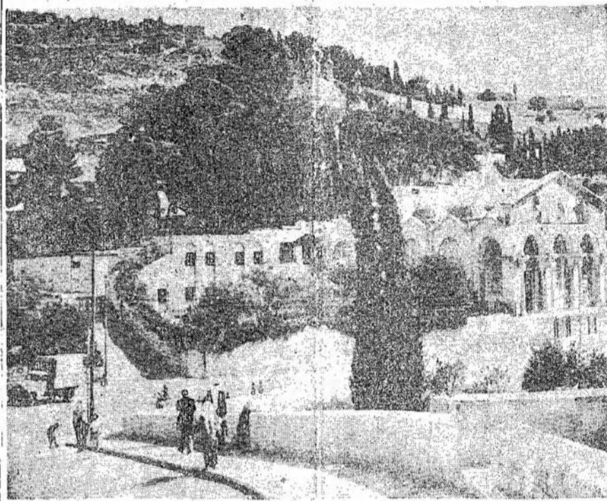
Anglų-amerikiečių komisija, kuri tyrinėjo Palestina, parabai dėl to kelia protestus jaus būtų įsileista Palest. ir šaukia streikus ne tik Palestinoj, bet ir kitose šalyse. Čia matote Visų Tautų bažnyčią Jeruzalime. Kairėj — Getesmano sodas.

Tyrinėtojai sako, kad nelaimės įvyksta dėl greito važiavimo, neblaivių vairuotojų ir blogo regėjimo.