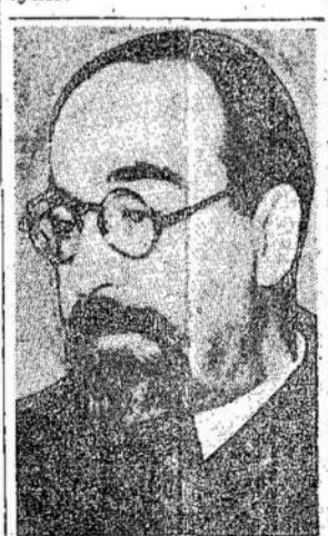
Dr. Fernando de los Rios, ispanų respublikonų vadas užsienyje, kuris spaudos konferencijoj New Yorke sakė, kad jis turi dokumentalių įrodymų, kad Frankas turi Francijos pasienyje 450,000 armijos ir turi agresivius planus.

Kad pralaužti užsikirtimą, konferencijos dalyviai eisį prie kitų šalių reikalų svarstymo.