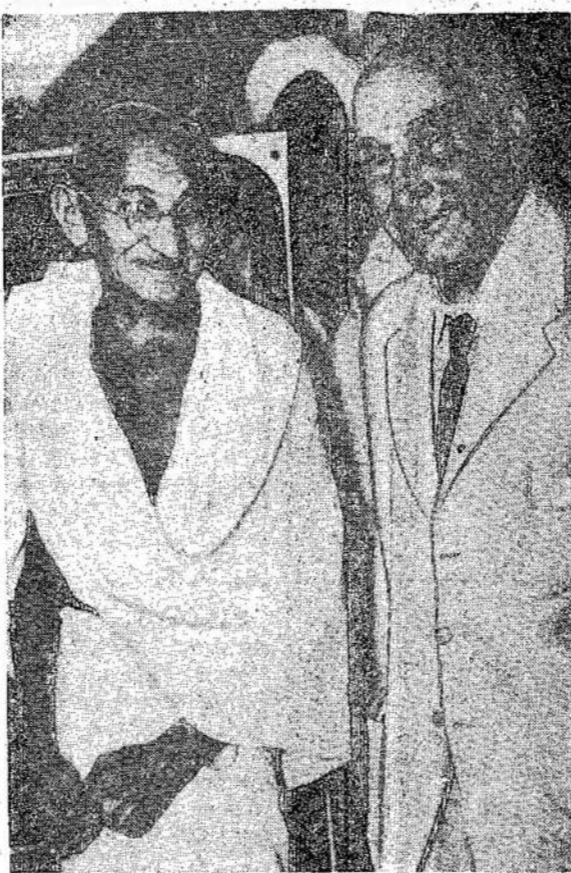
Mahatma Gandhi ir lordas nepriklausomybės Indijai Lawrence. Britų kabineto specialiai komisija taniai su Indijos vadais dėl davimo