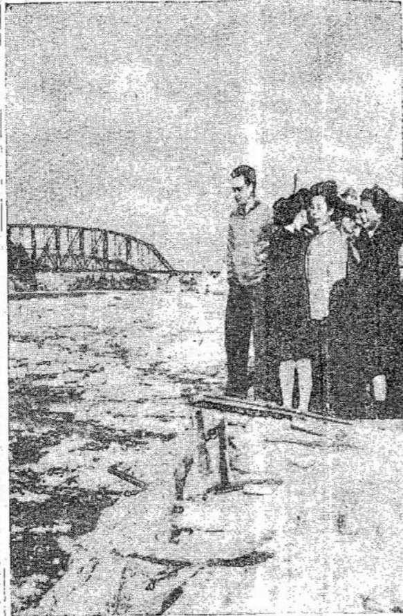
Tarp Alaskos gyventojų išsi- Siemtas pasimė visus pinigus. Siemtas tame fonde buvo $180,000. Laimėjo keli asmenys. Čia matote grupę žmonių prie upės tėjiančių ledo byrėjimo.