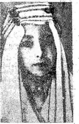
11 metų amžiaus Irako karalius. Jis su savo globėjais atvyksta Londonan. Irako valdžia yra probritiška.

Taigi, vancouveriečiai ir atvykusieji į Vancouverį galite užėiti pas kuopos knygyninką Emil Gerleth, 713 1/2 Cambie St., pasiskaityti laikraščius bei pasiimti knygų pa-