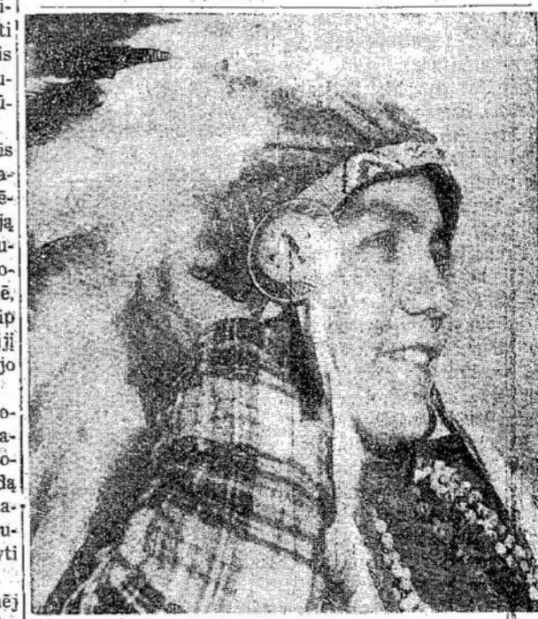
Kanados indijonai negali pamėgti moderniško gyvenimo ir aprėdai. Jie linksta prisėnovės. To pasekė didžiū-