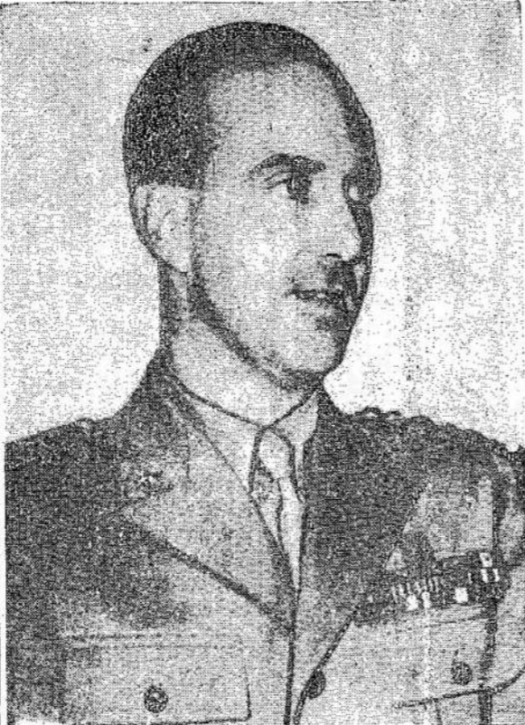
Naujas Italijos karalius, Umberto II, bet jo ūnienos gali būti neligos. Neuzilgo bus plebiscitas ir italai gali išbalsuoti jį lauk. Jis karalium tapo gegužio 9, kuomet jo tėvas abdikavo ir išvyko į Egiptą.

Mažesni sąjungininkų teismai nusmerkė mirtin 232 nacių ir jų talkininkus.