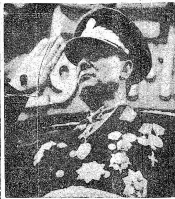
Kada Jugoslaviją valdė karaliai, šis žmogus gyveno „nelegaliai“. Jis turėjo slapto karinio ir turi gyventi už Jugoslavijos sienų. Taip tai vijos maršalas ir valdžios dalykai pasikeitė.

„Dešiniosios politinės partijos, kaip sėkmingos jėgos, visai išnyko. Prieš karą, jos atstovavo kapitalistinę laisvo užsiėmimo ekonominę filosofiją, kokią gina Jungtinės Valstijos. Nekuriuose Sovietų dominuojamoje šalyse šios dešiniosios jėgos visai išstumtos. Net ir vakarinėje