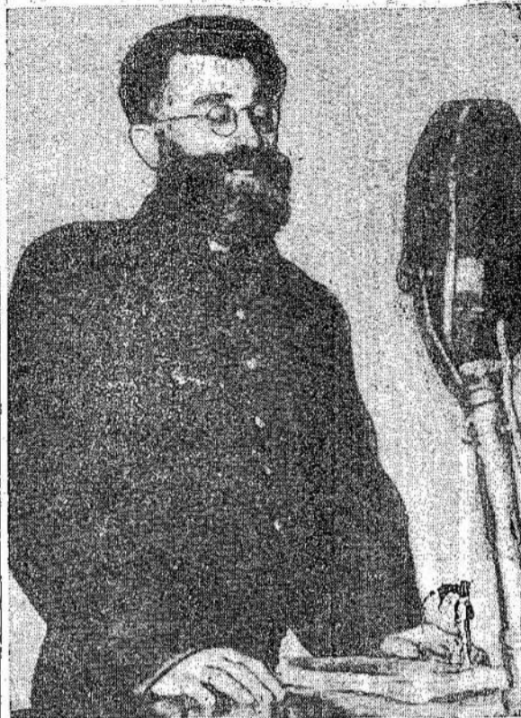
Generolas Draža Mihailović, o prieš partizanus. Jis išvarecetriku vadas, dabar teisiama. Belgrade. Jis sako, kad jam buvo duotos instrukcijos kovoti ne prieš vokiečius, o prieš partizanus. Jis išvarecetriku vadas, dabar teisiama. Belgrade. Jis sako, kad jam buvo duotos instrukcijos kovoti ne prieš vokiečius, o prieš partizanus.