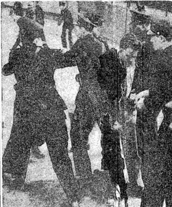
Provincialė policija valko ir suimtinėja jūrininkus streikičius Wellande. Vietomis buvo sutraukti policijos tiek, kad po 6 policininkus buvo prieš kiekvieną streikičių Tokio tikimo dar niekad nebuvo.

Advokatas Pritt ne pirmą kartą lėkė į kitą šalį ginti kitos šalies piliečius. Jis gynė visą eilę aukštų asmenų. Galima paminėti Tom Mann, Harry Pollittą ir kitus. Žymiausiu teismu, kuriame Pritt gynė kaltinamuosius, buvo Leipzigerio teismas, kuriame buvo teisiami George Dimitrov ir kiti vokiečiai, kaltinami reichstago padegime. Kaip paminate, Dimitrovas tame teisme išėjo pergaltėjum. Nemažai kredito už tai priklausė advokatai Pritt.