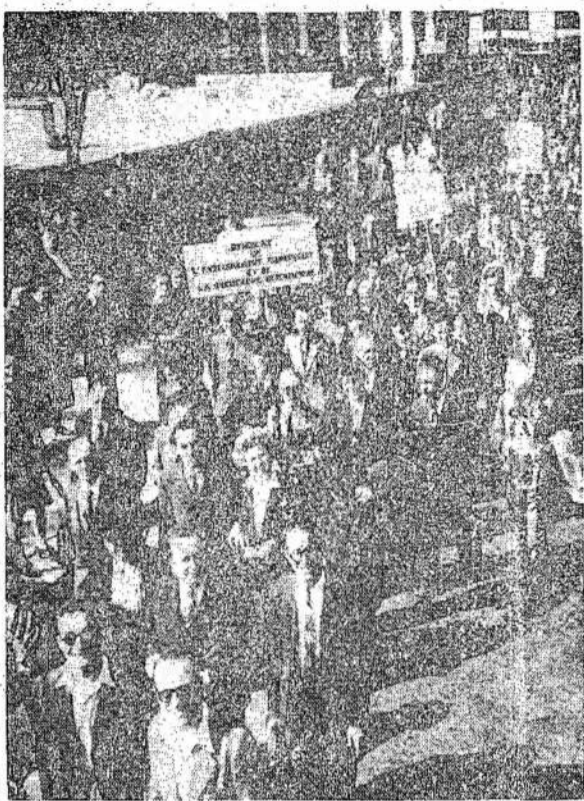
Dalis 5,000 mokytojų demonstracijai Paryžiuje. Jie demonstravo reikalavimą, kad būtų aukštesnių algų. Francijos valdžią, kol jo partija nesukomunistai iškovoję 15 nuotiko.

WASHINGTON. — Laiyno fotografijos sekcija praneša, kad netrukus publikai bus rodomos spalvotos filmos apie atominės bombos bandymą Bikini salose.