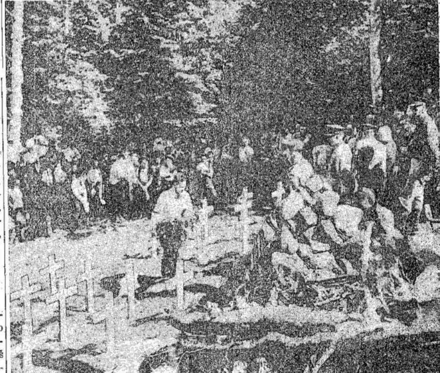
St. Donat miestelio majoras padeda vainiką pagerbimui 24 Kanados orlaivinkų, kurie žuvo jų orlaiviu susikūlus miške, netoli šio miestelio, 1943 metais. Nelsimės

Atrodo, naujienybė. Tačiau tai nėra jokia naujienybė, o labai senas dalykas. Išmuštų dantų atgal įsodinimu buvo susidomėję net aštuonioliktosimtmečio gydytojai, ir jie savo praktikoje turėjo keletą pasisekimų.