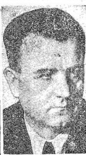
Klement Gottwald, Čekoslovakijos komunistų vadas, kuris šiomis dienomis tapo Čekoslovakijos premjeru. Jo kabinetą prezidentas Benešas jau užtvirtino.

Laikė balsavimų Lenkijos žmonės didelę didžiumą balsų pasisakė už vienus parlamentu rūmus, užgėrė Lenkijos sienas ir tuomi davė suprasti fašistams, kad jie stovi su dabartine valdžia.