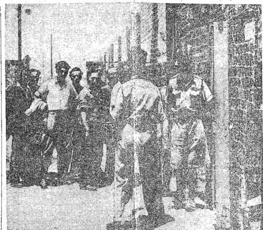
Nelegaliai įvažiuojantys į Palestiną žydus varo į koncentracijos kempes. Sakoma, kad nekuriuose kempėse žydai gyvena kaip žydai, kaip jie gyvena Vokietijos kempėse. Čia matote policiją varant žydus į vieną tokią kempę Palestinoje.

Laikė karo Graikijoj buvo sugriauta 2,000 miestų ir kaimų, sunaikinti uostai ir fabriškai.