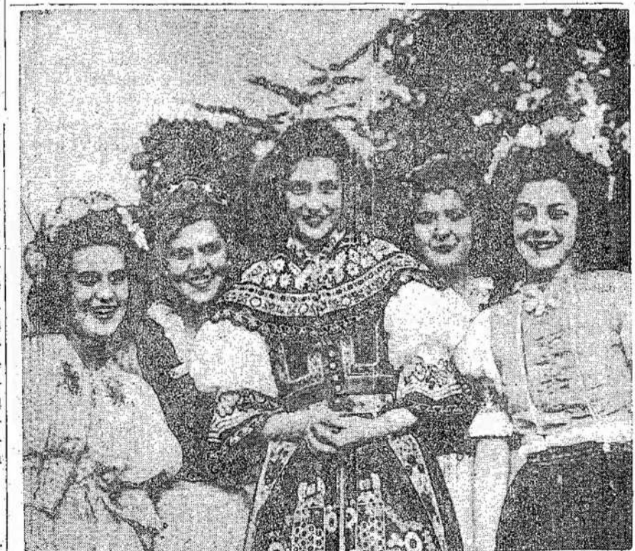
Hamiltono 100 metų sukaktuvių iškilimėse plačiai figuravo įvairūs tautiniai kostiumai. Tai buvo gražus pajai-

rinimas. Ateiviai, savo kostiumais, dainomis ir kitais kultūriniais atsinešimais, pagražino šio krašto kultūrinį