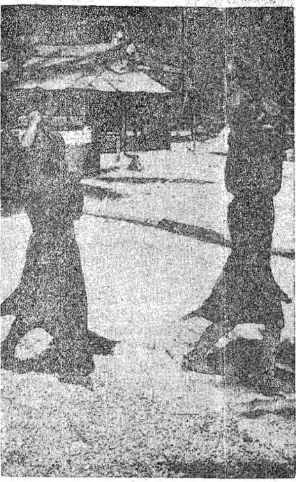
Čia matote Bikini gyventojus nešantis savo turta ant pečių. Jiems reikėjo apleisti savo namus, kadangi amerikiečiai norėjo išbandyti atomines bombas prie jų namų. Jeigu kada kils atominis karas, visų miestų gyventojai turės bėgti iš miestų su savo daiktalais.